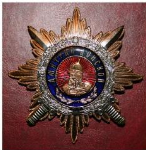
Орден Дмитрия Донского