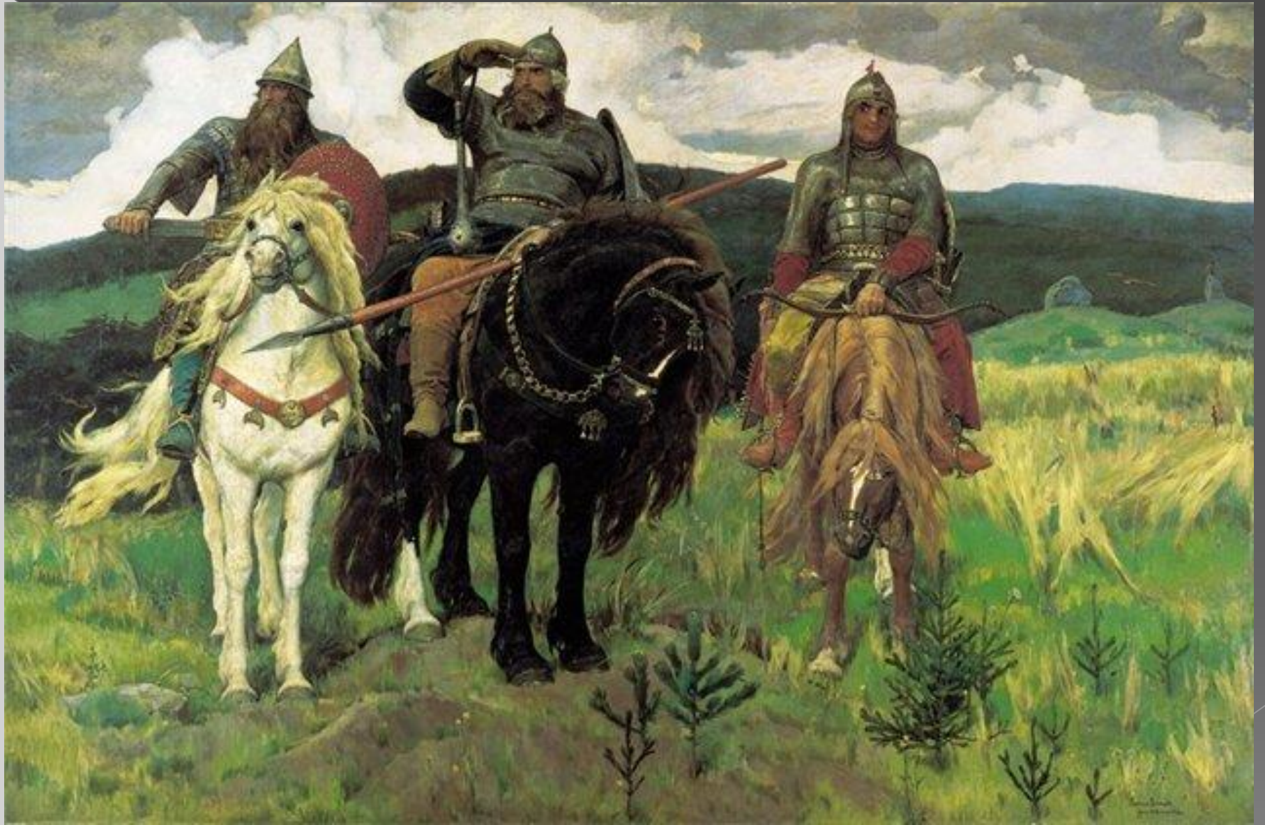
В. Васнецов «Богатыри»