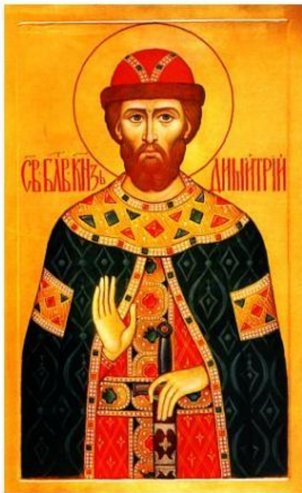
СВЯТОЙ БЛАГОВЕРНЫЙ КНЯЗЬ ДМИТРИЙ