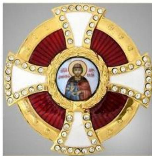
Орден Дмитрия Донского I степени