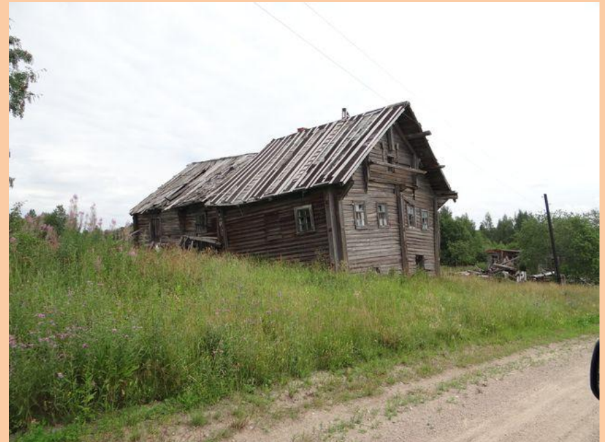
Дом жилой № 1, д. Кукшегоры