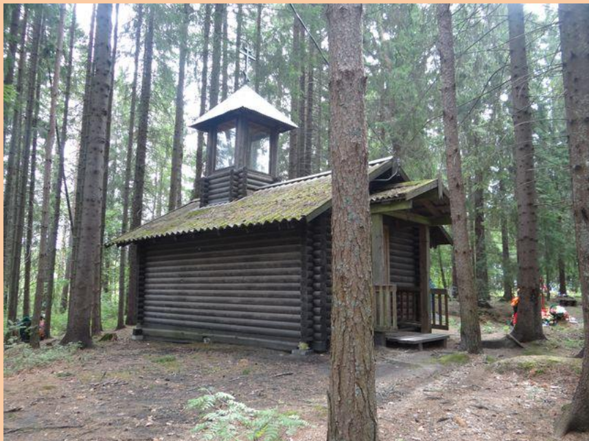
Часовня в культовой роще в д. Нурмолицы