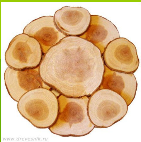
Вариант № 1 № 2