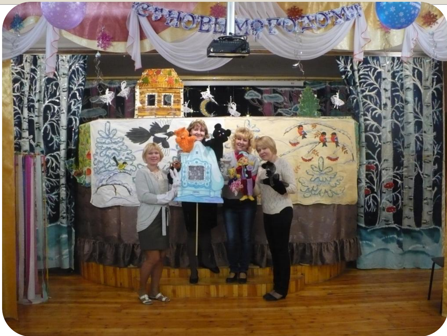
Кукольный спектакль «Заюшкина избушка»