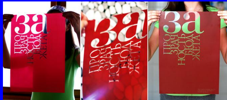
«два в одном»