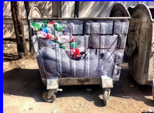
личное обращение, эмоции (включая «ШОК-КОНТЕНТ»)