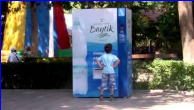
интерактив (живое взаимодействие)