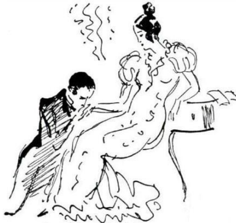
«Евгений Онегин». Глава 8. Последняя встреча Онегина с Татьяной. Художник Н. Кузьмин. Источник: Пушкин А. С. Евгений Онегин: Роман в стихах / Худож. Н. Кузьмин. – М.: Дет. лит., 2002. – С. 166. Иллюстрации на сайтах «К уроку литературы» и «Литература для школьников»