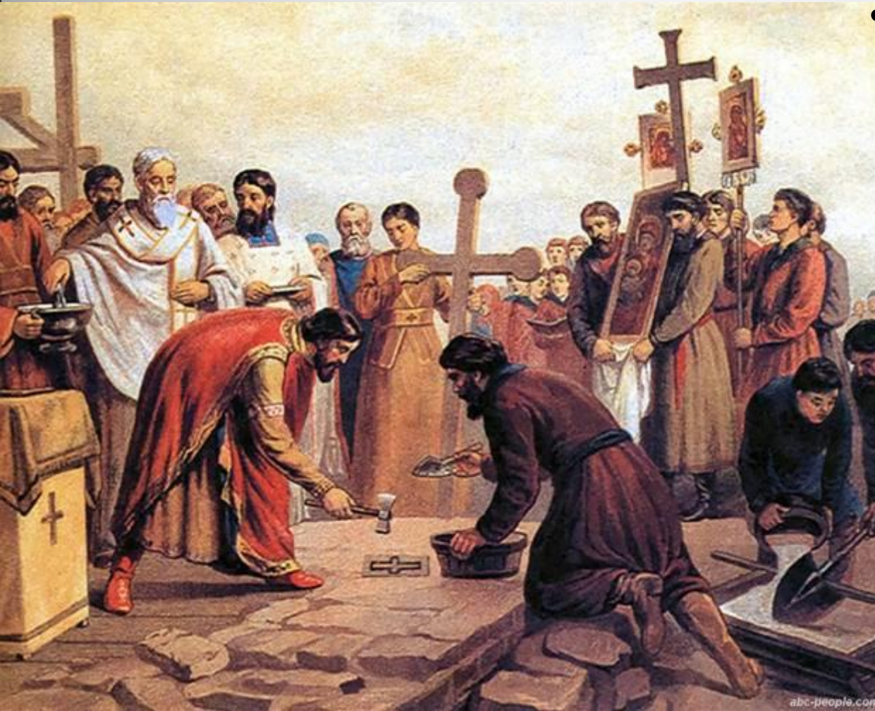
Верещагин В. П. «Закладка Десятинной церкви в Киеве»