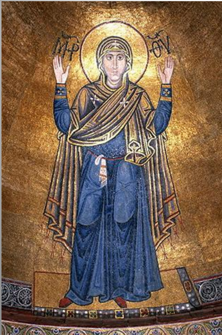
Богоматерь Оранта (Нерушимая Стена). Мозаика в алтаре собора, XI век.