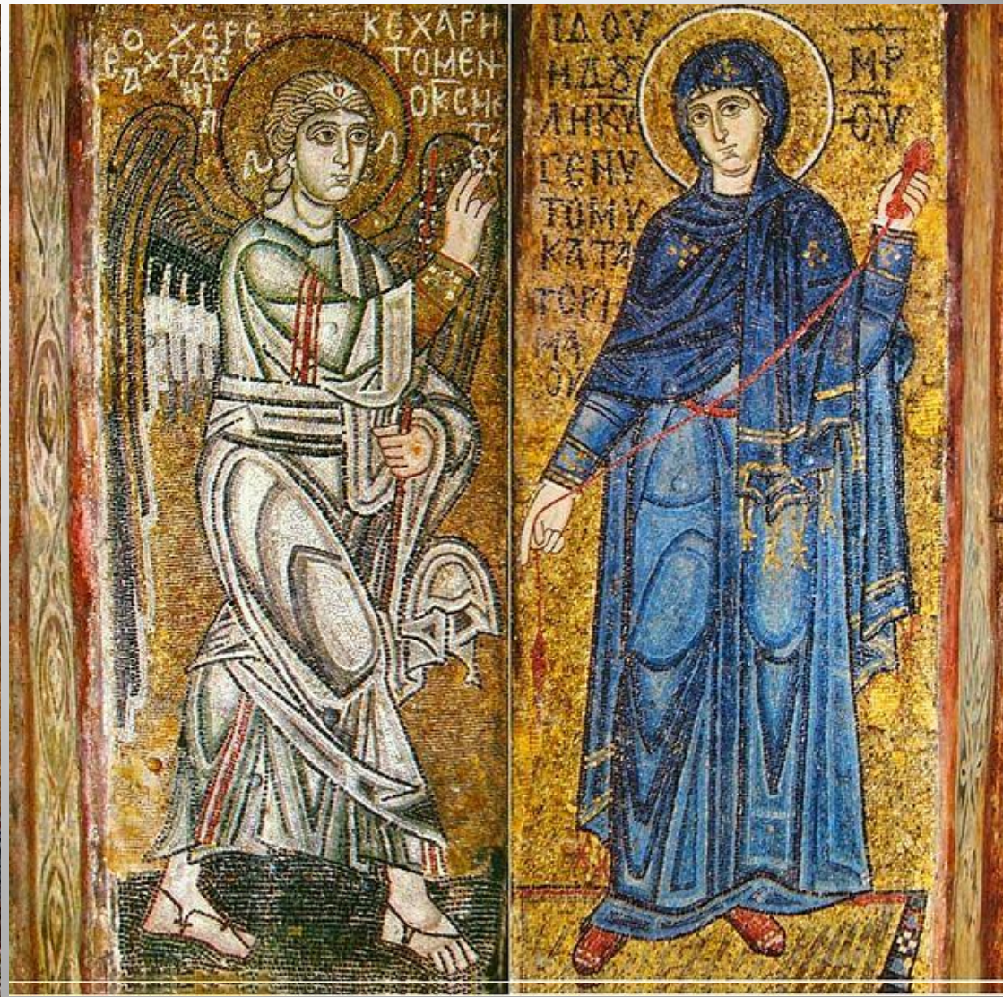
Благовещение. Мозаика на алтарных столбах, XI век.