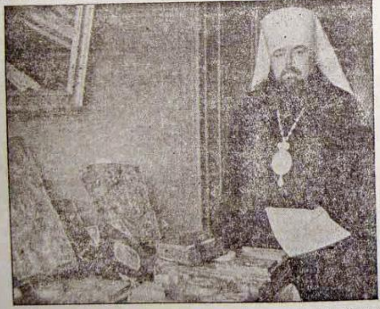
Экзарх-митрополит Сергей знакомится с ценным подарком — старинными духовными книгами