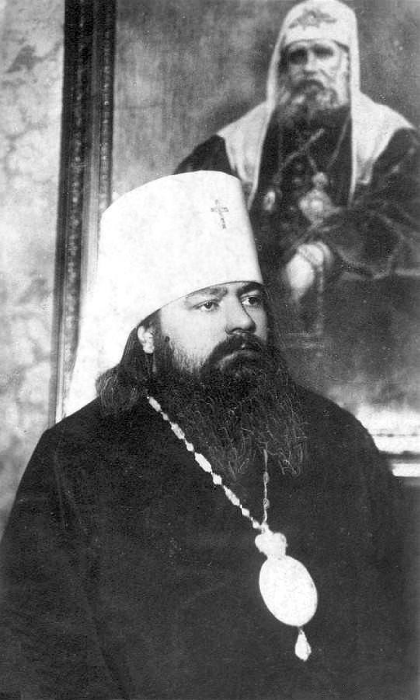
Сергий (Воскресенский), Патриарший экзарх Прибалтики