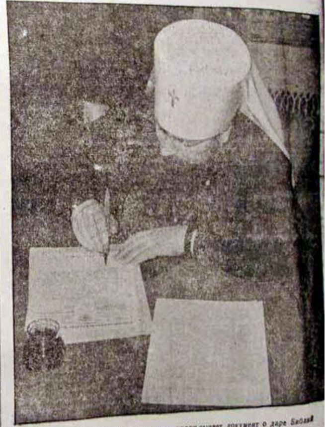
Глава русской православной церкви подлиывает документ о даре Библий

Искренне растроганный ценным даром, экзарх Сергей выразил от имени православной церкви свою благодарность: «Благодарю вас за спасение этих священных писаний не только, как представитель православной церкви Латвии, но также и всех церквей России, частью уже освобожденных германской армией, частью — еще страдающих под ярмом большевизма. Благодарность всех крестьян выразиться в общей борьбе с большевизмом. В этой борьбе, являющейся в то же время борьбой за свободу веры, примут участие не только церковные власти, но и весь народ. Прежде всего, мы благодарим великого германского Фюрера, спасающего Европу от красных захватчиков. Особенно благодарим Адольфа Гитлера, который, в тяжелую годину войны нашел время позаботиться о сохранении культурных ценностей и велел вернуть русской Церкви ее имущество. Мы молим Всевышнего, чтобы он и впредь ниспослал Адольфу Гитлеру силу и крепость для окончательной победы над большевизмом.