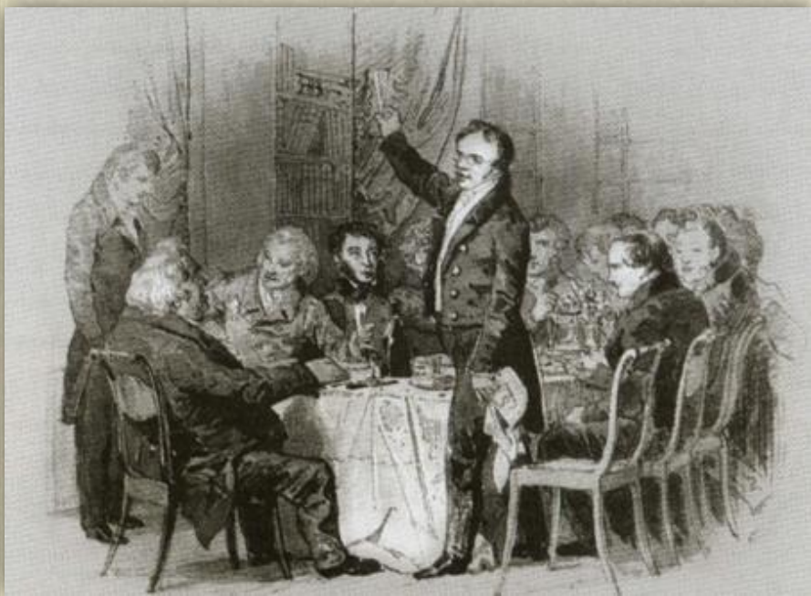
Торжественный обед у А. Ф. Смирдина.