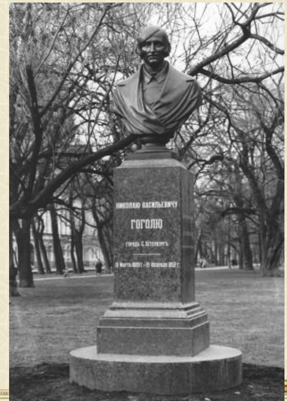
Памятник Н. В. Гоголю в Александровском саду. Ск. В. П. Крейтан