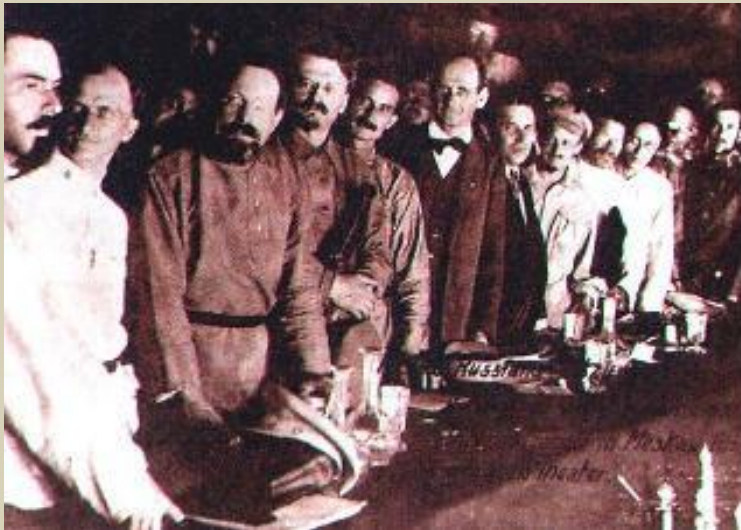
Л.Троцкий на II конгрессе Коминтерна