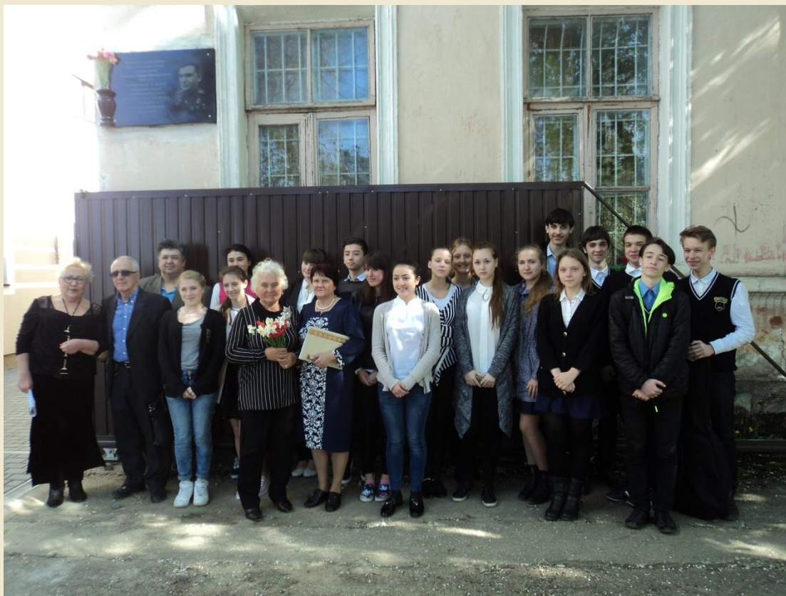
13 апреля 2015 года. Открытие обновлённой мемориальной доски на здании библиотеки им. Л. Н. Толстого.