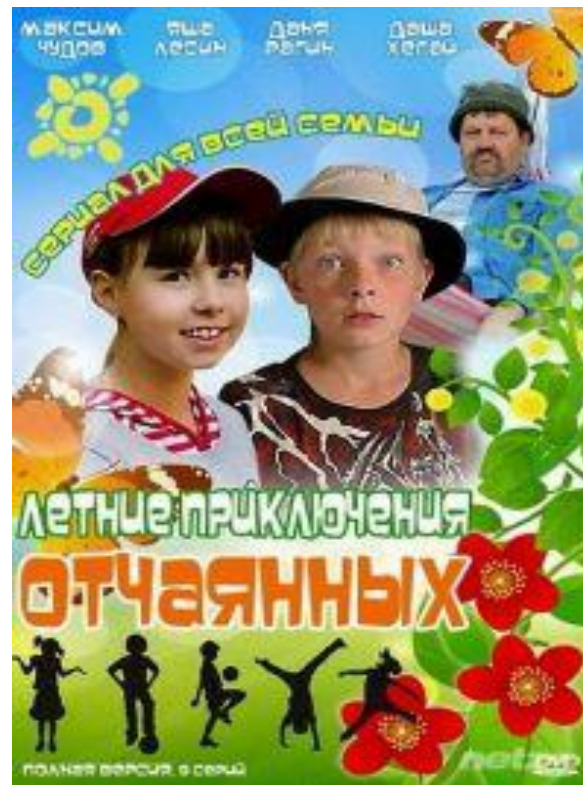
Летние приключения отчаянных (2010) Реж. Борис Шварцман