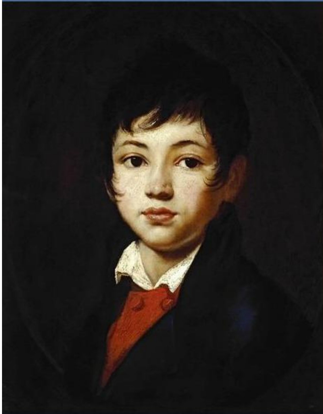
Портрет А.А. Челищева (ок. 1808)