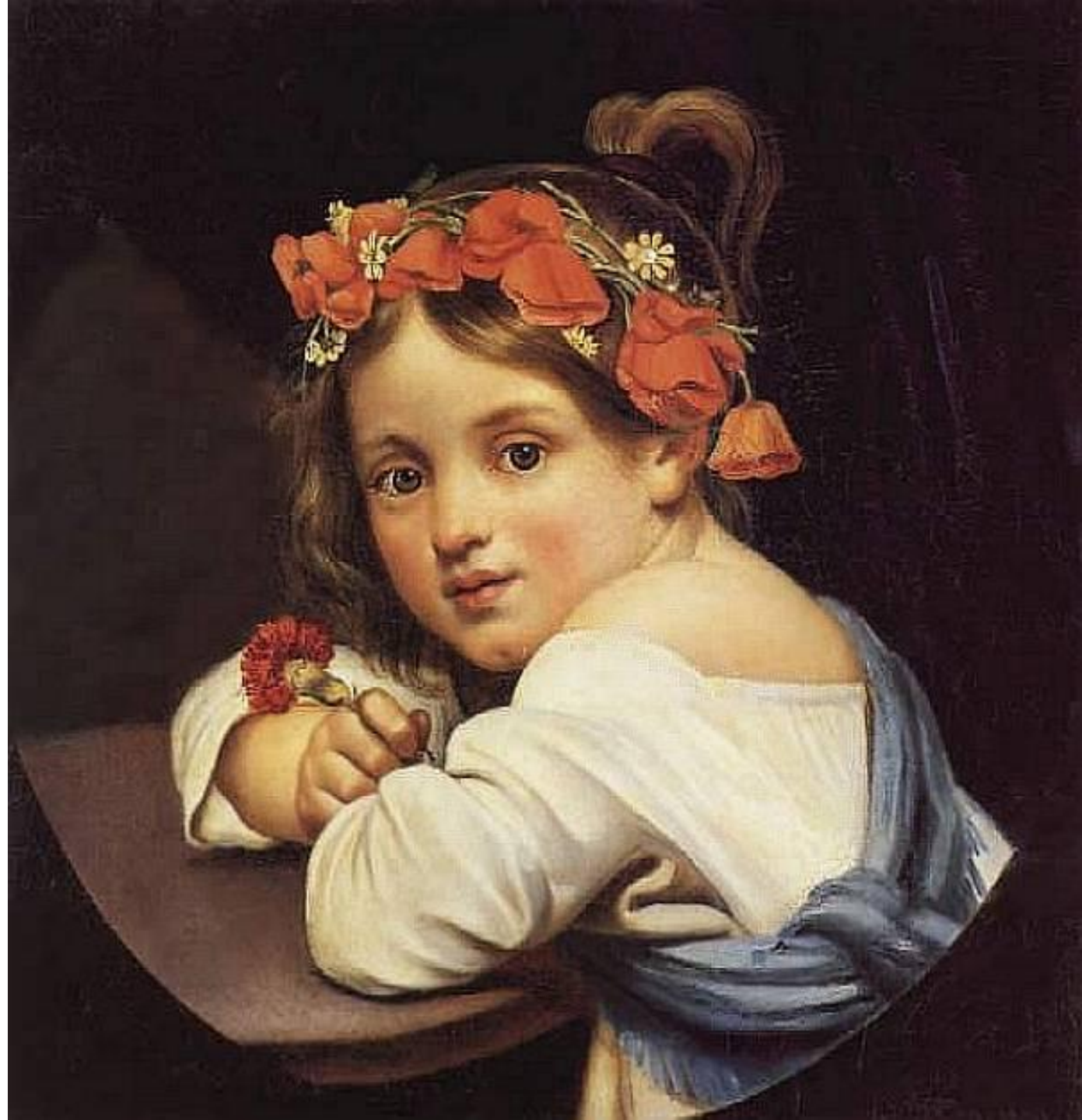
«Девочка в маковом венке с гвоздикой в руке» 1819