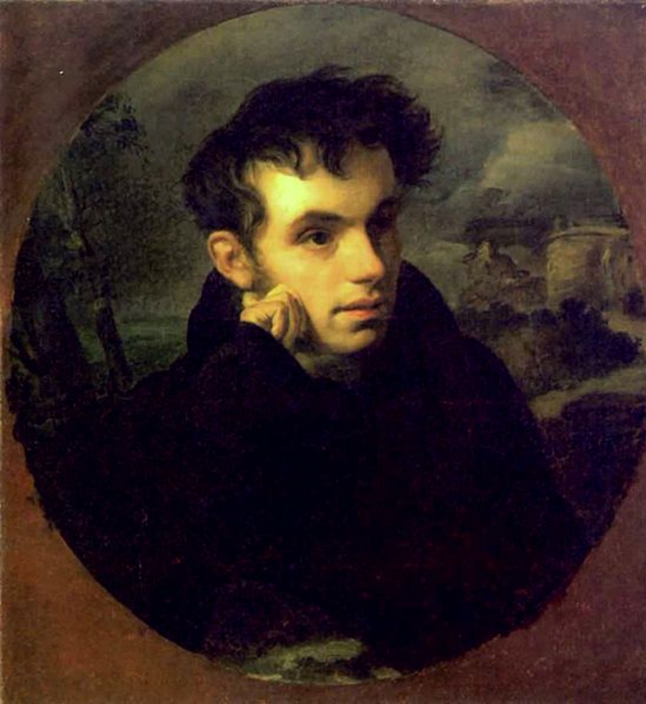
Портрет В. Жуковського 1816