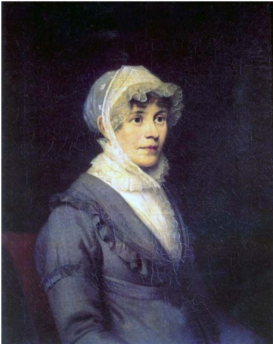
Портрет графини Ростопчиной