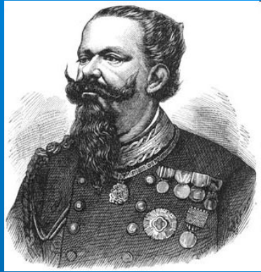
Виктор Эммануил II