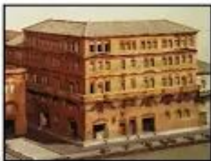
Многоэтажный дом в Древнем Риме

Многоэтажные дома Рима были подвержены частым обвалам, потому что использовали некачественные строительные материалы.