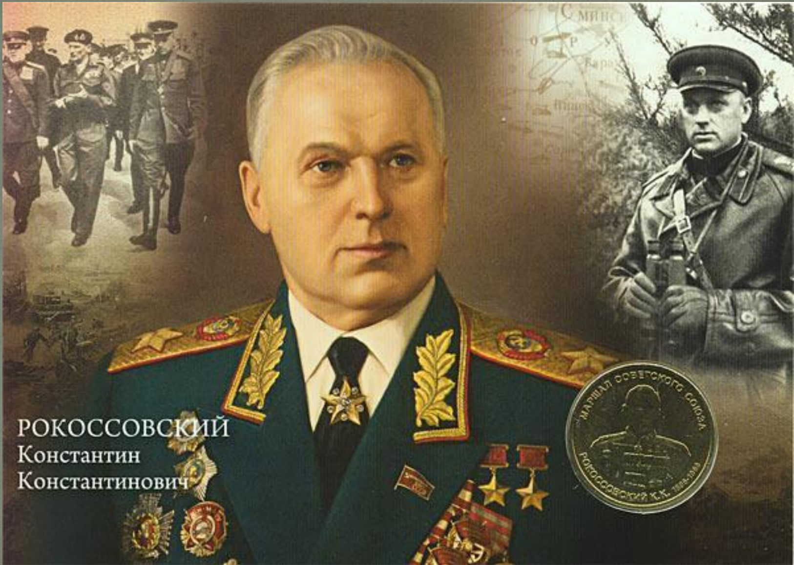
РОКОССОВСКИЙ Константин Константинович