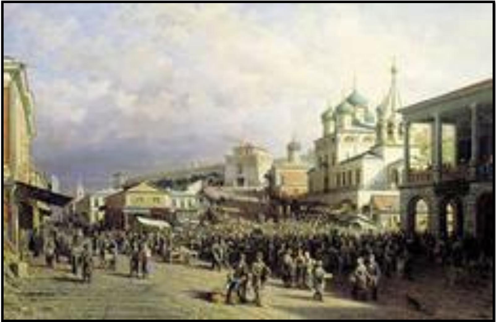
П. П. Верещагин «Рынок в Нижнем Новгороде»