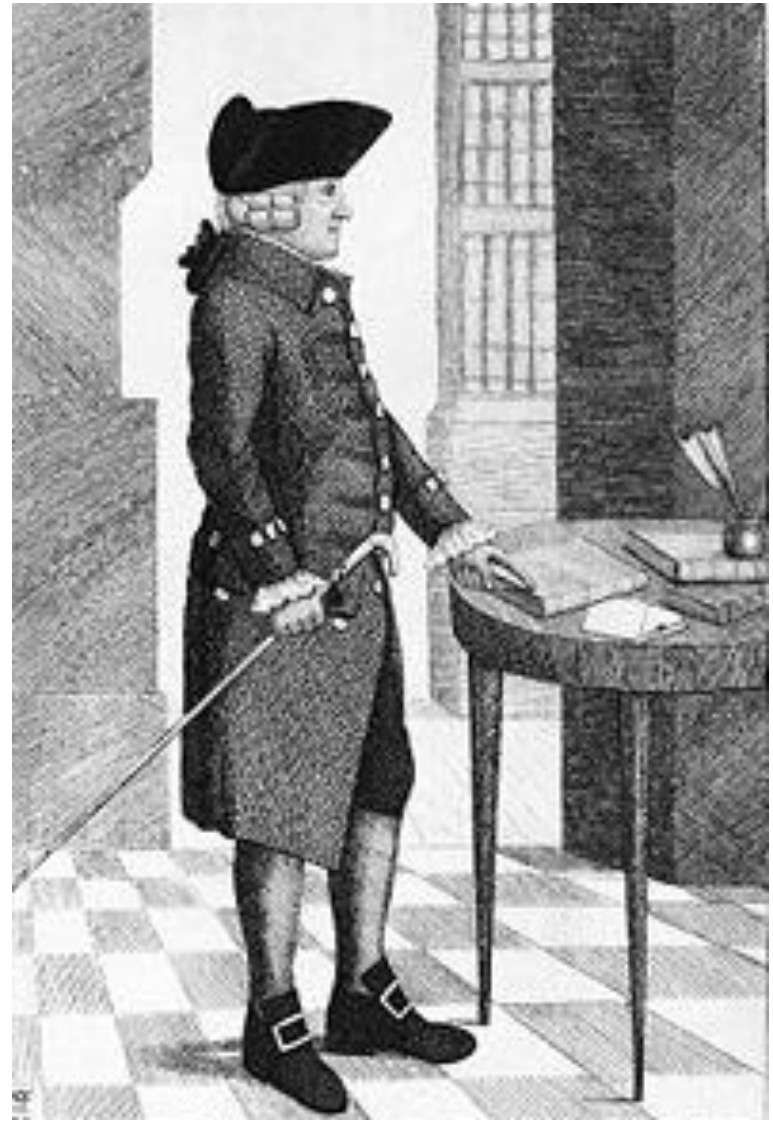
Адам Смит (1723 – 1790)