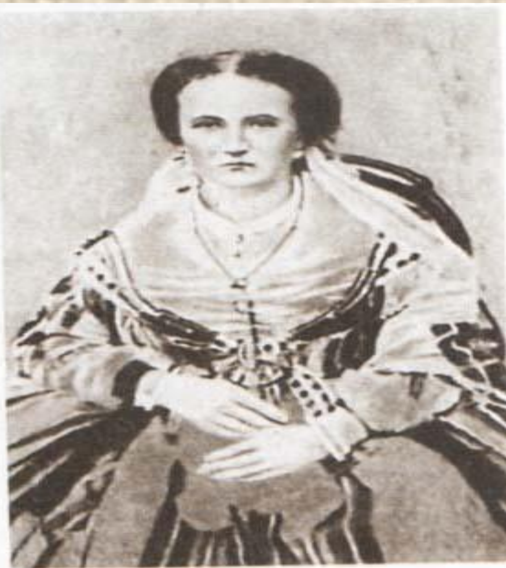
11 ♣ Л. П. Никулина- Косицкая, актриса Малого театра