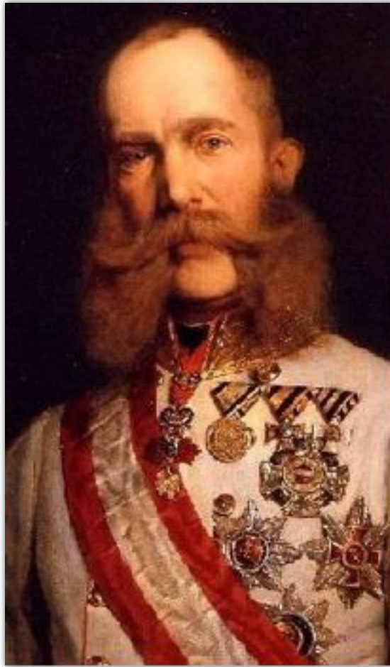
Франц Иосиф I (1830 -1916 гг.)