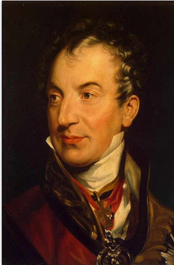
Клемент Меттерних (1773 – 1859 гг.)