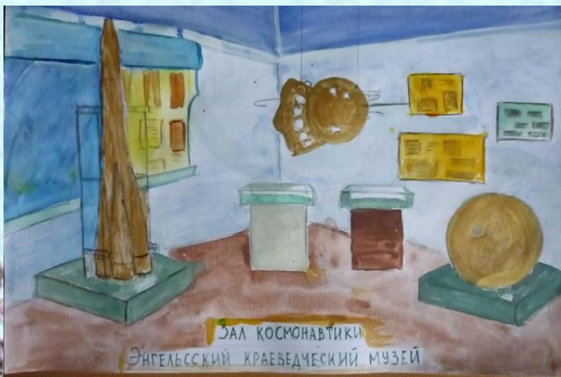
Зал космонавтики Энгельсский краеведческий музей