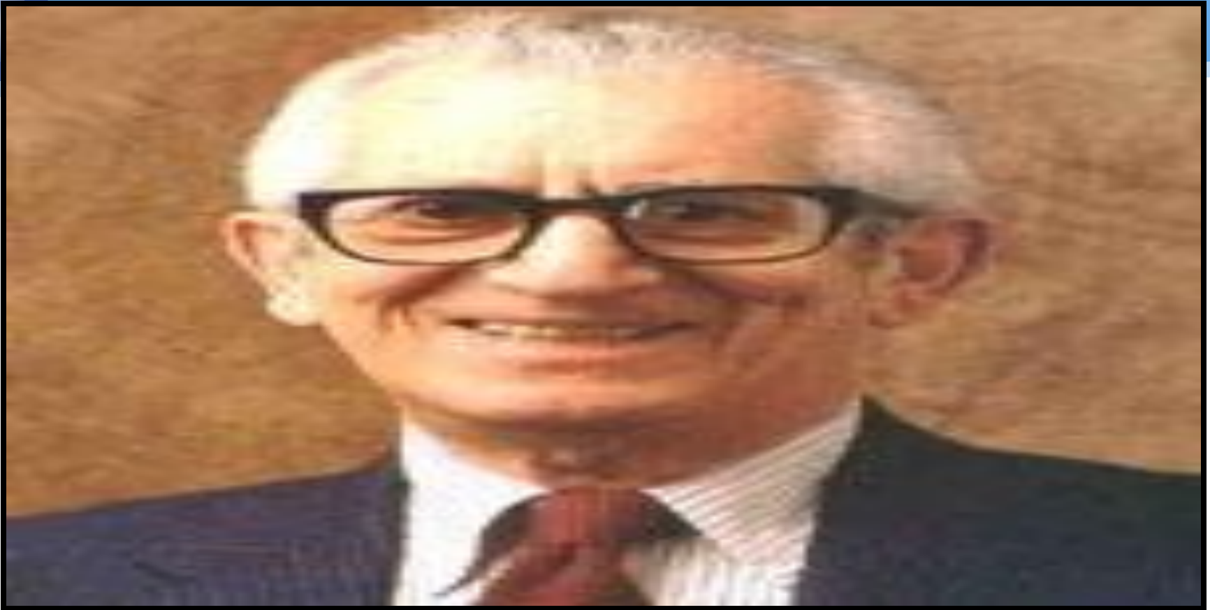
Бенджамин Блум (1913-1999)

Литература: Bloom B.S. (ed.). Taxonomy of Educational Objectives: The Classification of Educational Goals. Handbook 1: Cognitive Domain. N.Y.. David McKey Co. 1956.