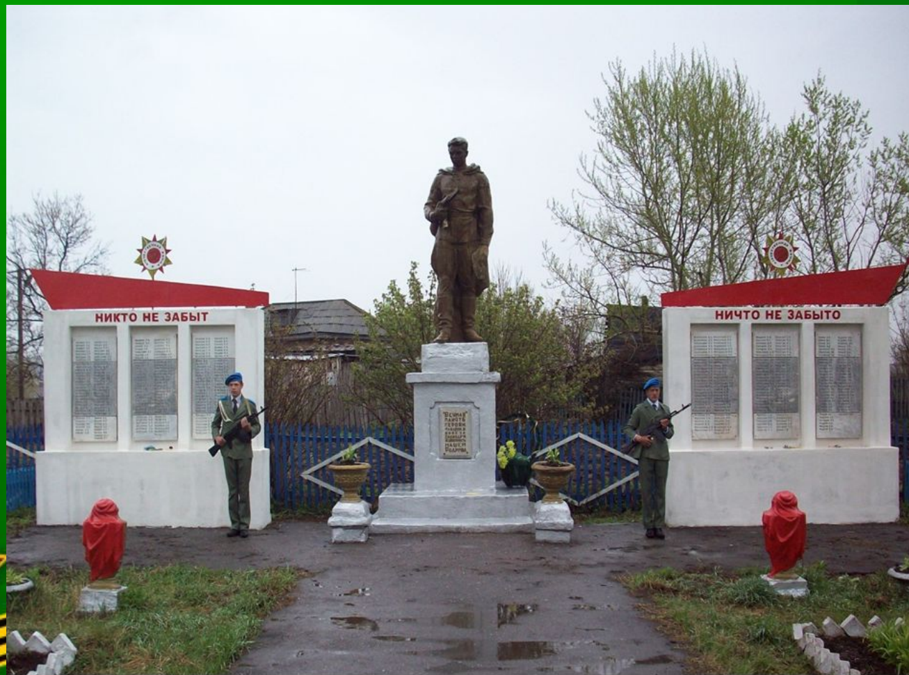
Памятник воинам погибшим в Великую Отечественную войну село Воскресенское 2009 год