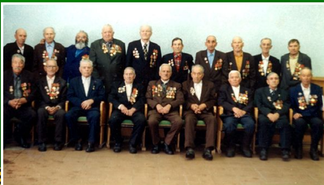
Ветераны - воскресенцы, встретившие 60 - ление Победы 2005 год