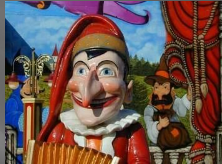
в Чехии — Кашпарек.