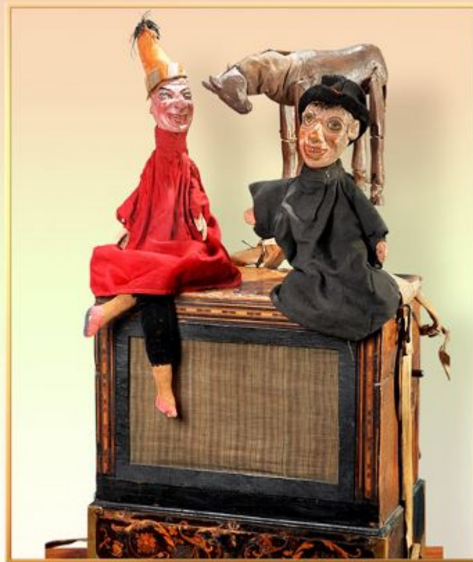
Петрушка, лекарь, лошадь и шарманка

По характеру (смелости, дерзости, насмешливости) все они — родственники нашего Петрушки.