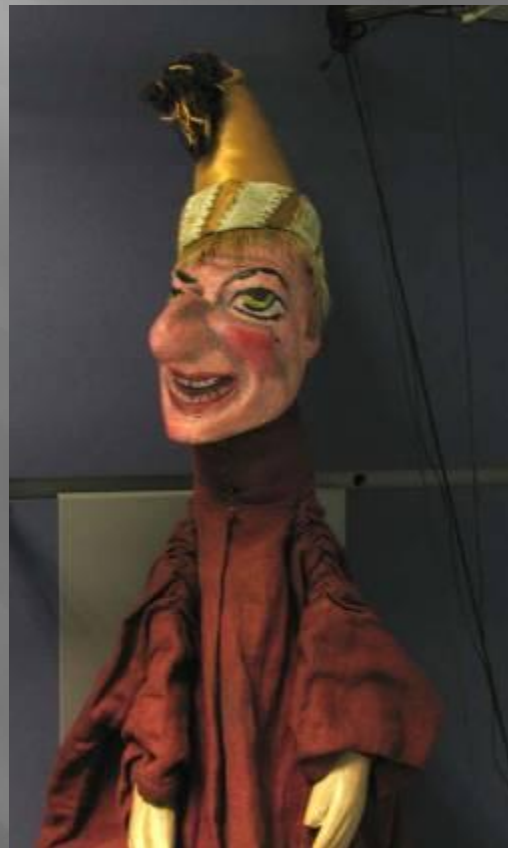
в Голландии — Пикельгеринг,