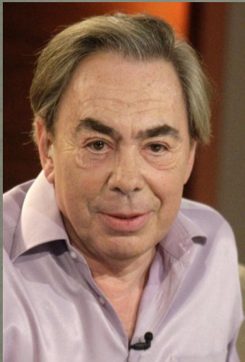
Эндрю Ллойд Уэббер