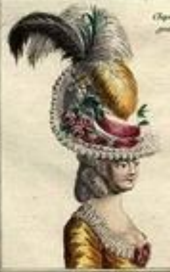
Chapeau des amans par