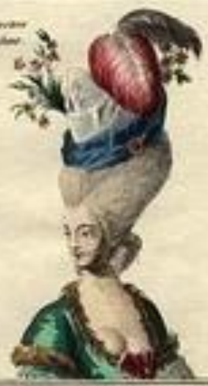
Amant au spectacle ou chez Colette