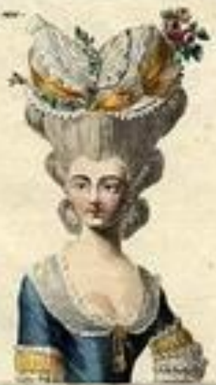
Amant des ma- sons, par