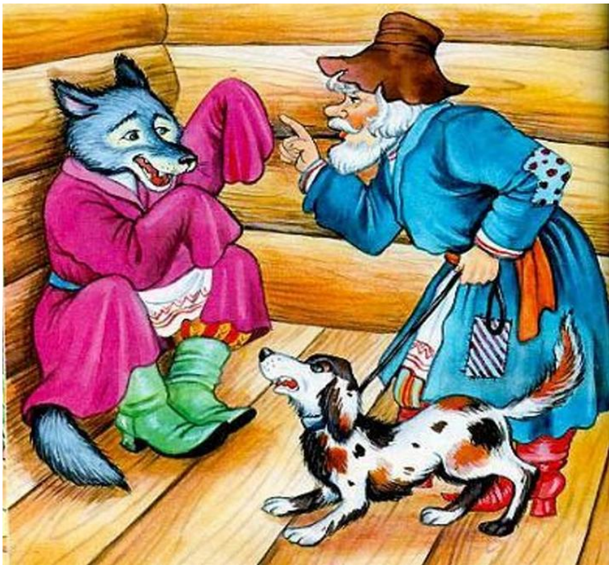
И. А. Крылов “Волк на псарне”