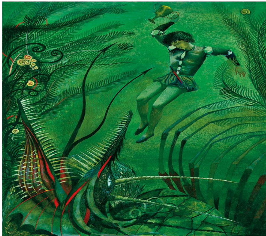
В. А. Жуковский “Кубок”