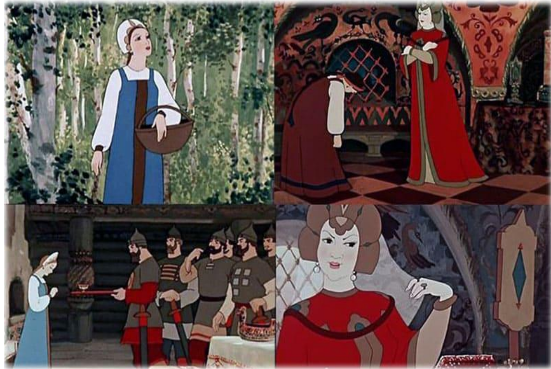
А. С. Пушкин “Сказка о мёртвой царевне и о семи богатырях”