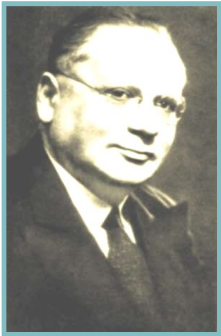
Нарком иностранных дел М.М. Литвинов

«Новый курс» советской дипломатии – создание системы коллективной Безопасности.