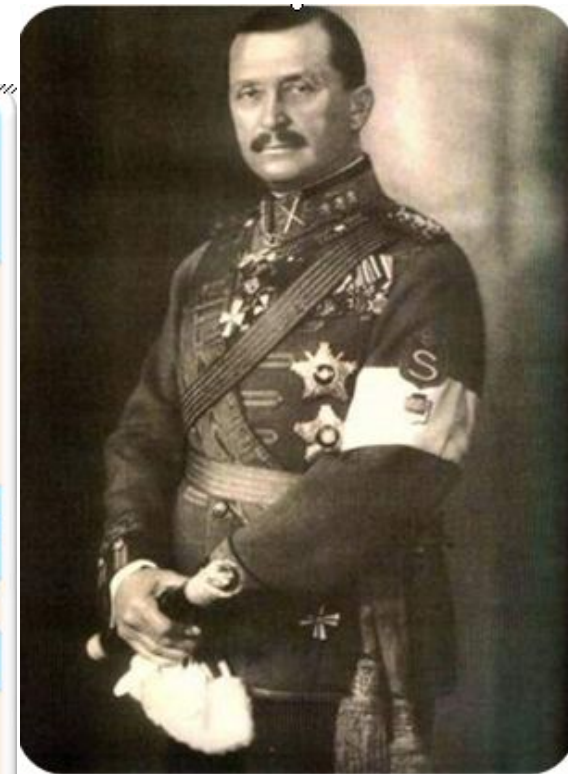
Карл Густав фон Маннергейм