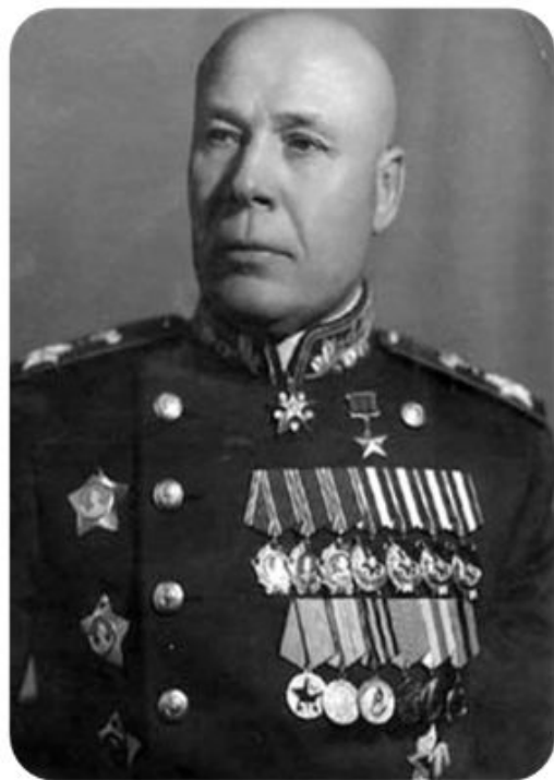
Семен Константинович Тимошенко