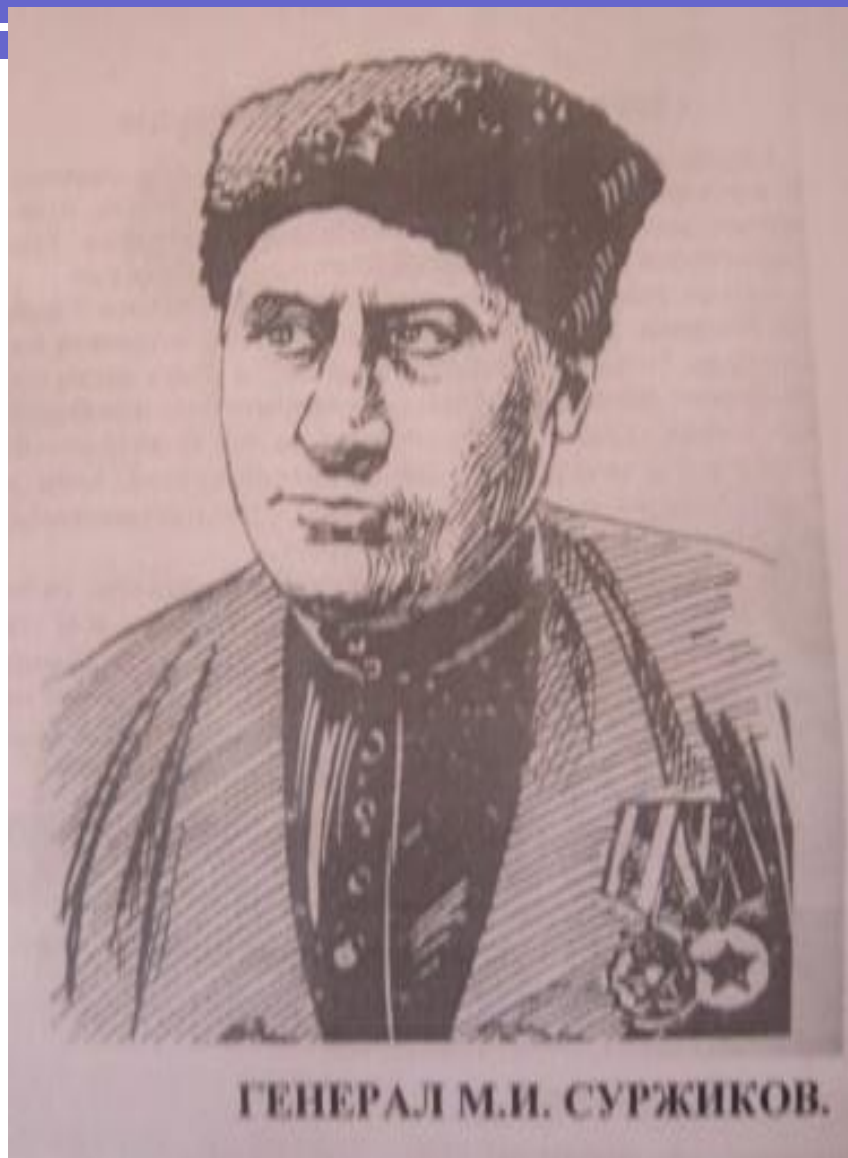
ГЕНЕРАЛ М.И. СУРЖИКОВ.