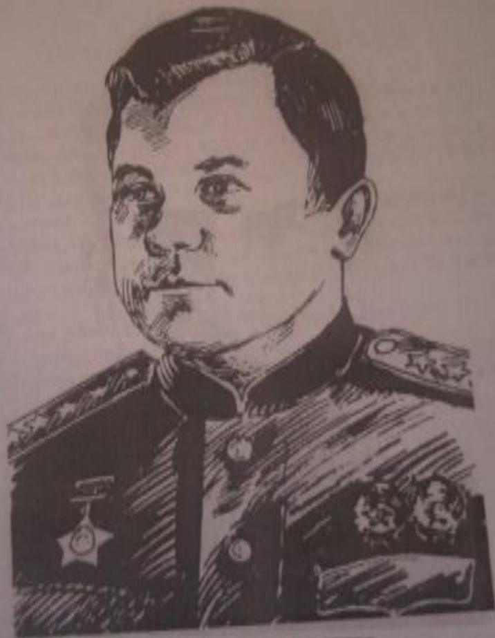
ГЕНЕРАЛ АРМИИ НИКОЛАЙ ФЕДОРОВИЧ ВАТУТИН

18 декабря 1901 года рождения. Генерал армии.