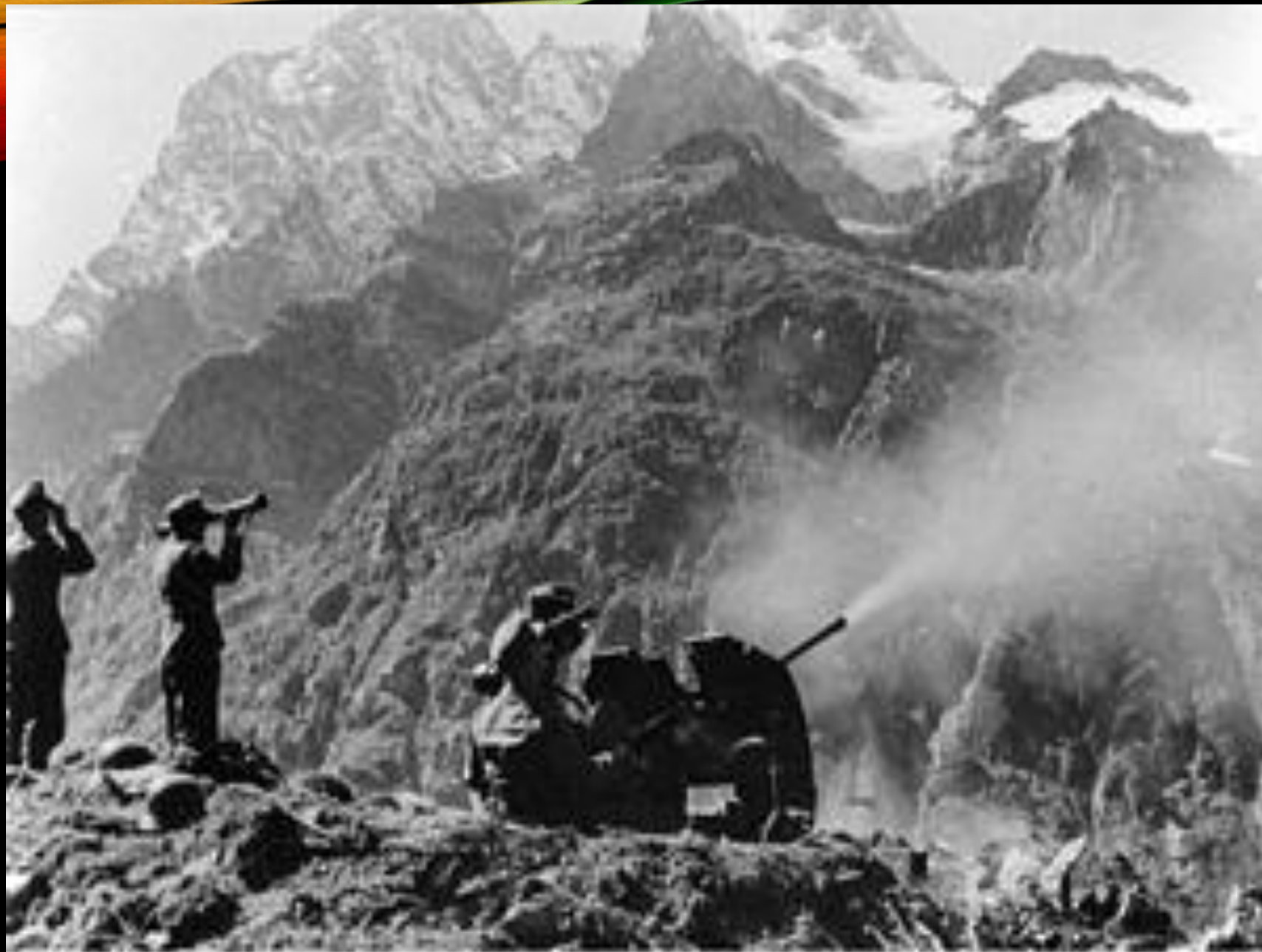
WASHINGTON, D.C. (AP) — A U.S. soldier operating a machine gun during the Battle of Iwo Jima, Feb. 19, 1945.