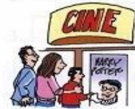
ir al cine