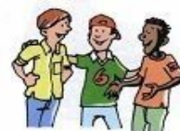
quedar con los amigos