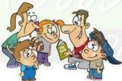
Compartir con la familia