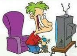
Jugar con videojuegos