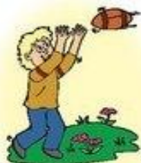
el fútbol americano