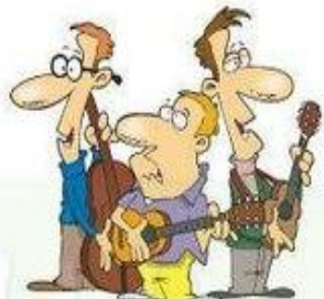
Tocar un instrumento