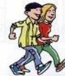
dar un paseo