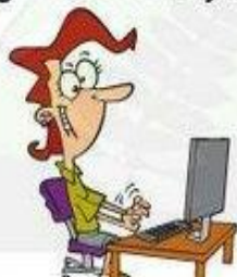
Navegar por internet