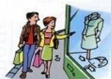
ir de compras