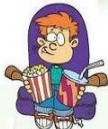
Ir al cine