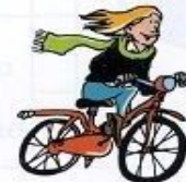
montar en bicicleta