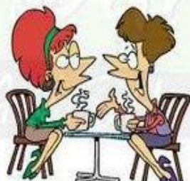
Salir con amigos