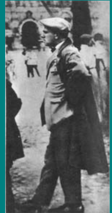
В. Маяковский на Красной площади 1928 год