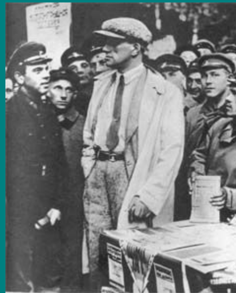
В. Маяковский на книжном базаре среди красноармейцев 1929 год