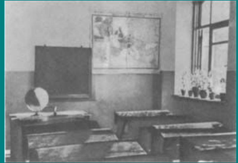
Классная комната кутаисской гимназии.

В 1902 г. В. Маяковский поступил в гимназию в Кутаиси. В июле 1906 г. от заражения крови умер его отец. После похорон отца Маяковский с матерью и сёстрами переехал в Москву, где поступил в IV класс 5-ой классической гимназии. В марте 1908 г. исключён из V класса за неуплату за обучение.