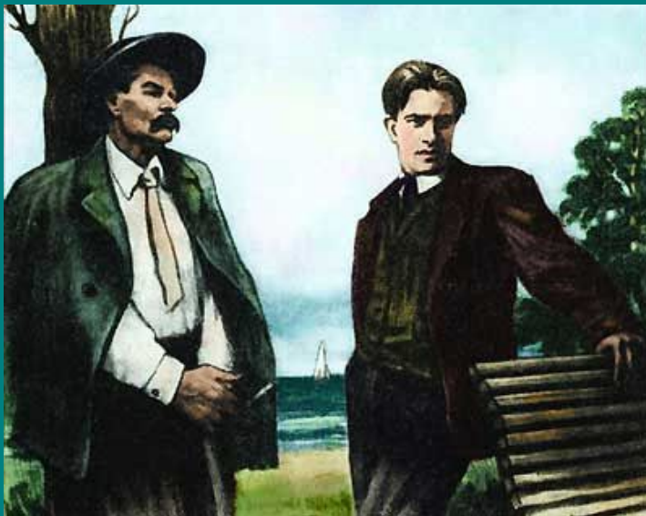
В. Маяковский и М. Горький