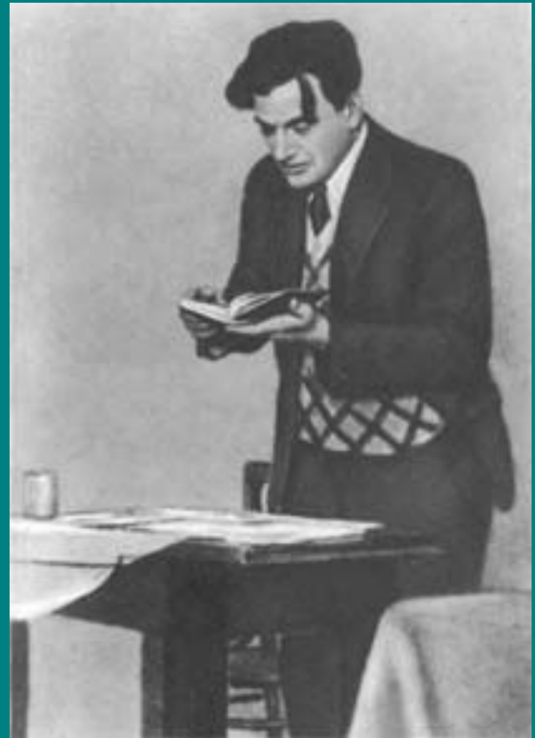
В.В. Маяковский 1930 год

С 15 по 17 апреля через зал Клуба писателей, где был выставлен гроб с телом поэта, прошло сто пятьдесят тысяч человек. 17 апреля состоялся траурный митинг и похороны в Москве, на Новодевичьем кладбище.