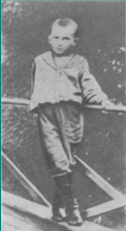
Володя Маяковский 1900 год

«В июле у нас в семье большой праздник. Володя родился в день рождения отца — 7 июля (по новому стилю 19 июля) 1893 года, — поэтому его и назвали Владимиром».