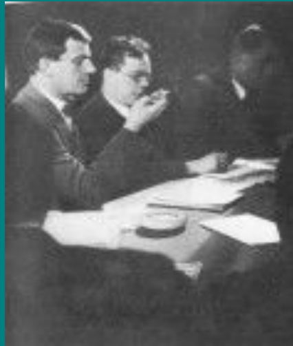
В.В. Маяковский на встрече с украинскими писателями в Госиздате, 1929