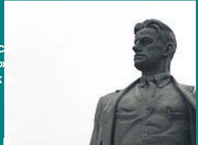
Памятник Маяковскому в Москве на Триумфальной площади

В 1983 г. в Киеве именем Владимира Маяковского назван проспект (жилой массив Троещина, Деснянский район). В 1997 г. была учреждена «Всероссийская литературная премия имени В. В. Маяковского». 14 апреля 2005 г. фирмой «АнТроп» был выпущен альбом-трибьют «Живой Маяковский» – диск с песнями на его стихи, музыку к которым сочинили современные музыканты. 19 июля 2008 г. в свет вышел второй диск.