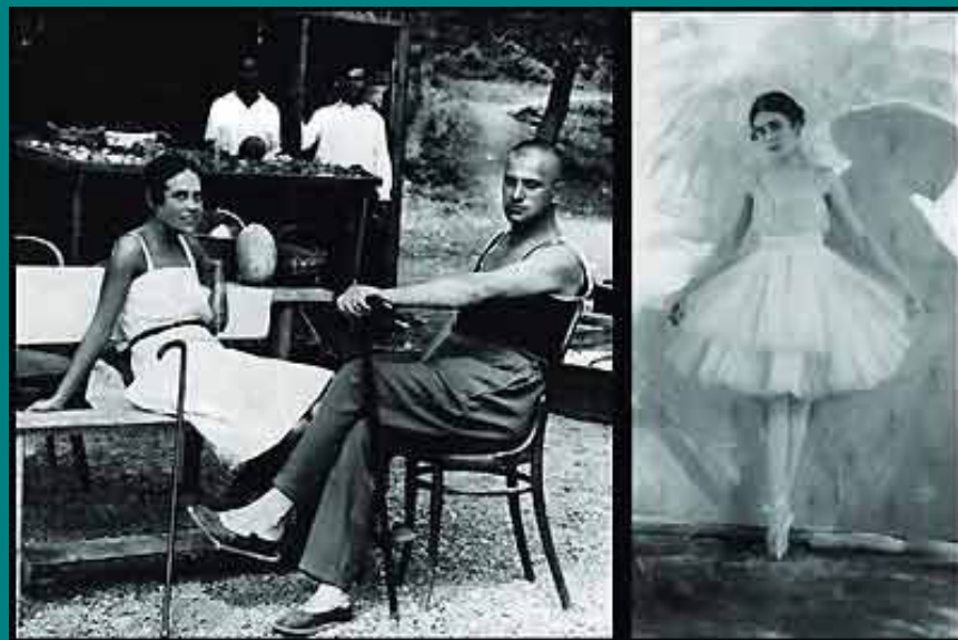
В. В. Маяковский и Л.Ю. Брик на отдыхе в Ялте, 1926

Любовь «вымучивает душу» одинокого поэта. Лиля Брик заняла центральное место в его жизни. Из своих отношений поэт-футурист и его возлюбленная стремились построить модель новой семьи. С именем Брик связаны многие произведения поэта.