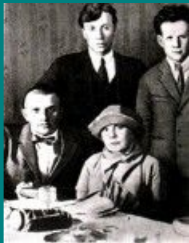
Б.Л.Пастернак, С. М.Эйзенштейн, В.В.Маяковский, Л.Ю.Брик

В июле 1915 г. поэт познакомился с Лилей и Осипом Бриками. В 1915 - 1917 г. Маяковский проходил военную службу в Петрограде в автошколе. Солдатам печататься не разрешали, но Осип Брик выкупил поэмы «Флейта-позвоночник» и «Облако в штанах» по 50 копеек за строку и напечатал.