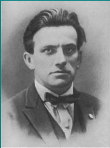
В.В. Маяковский 1925 г.

В 1925 - 1929 г. В. Маяковский много ездил по Советскому союзу, выступал в различных аудиториях