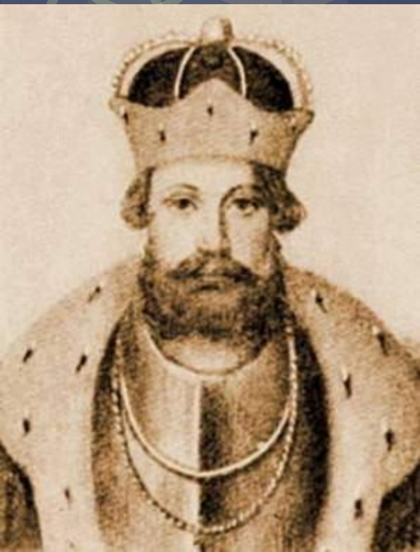
Михаил Ярославич Тверской

В борьбу за великое княжение вступили князья Михаил Ярославич и Андрей Александрович Тверской