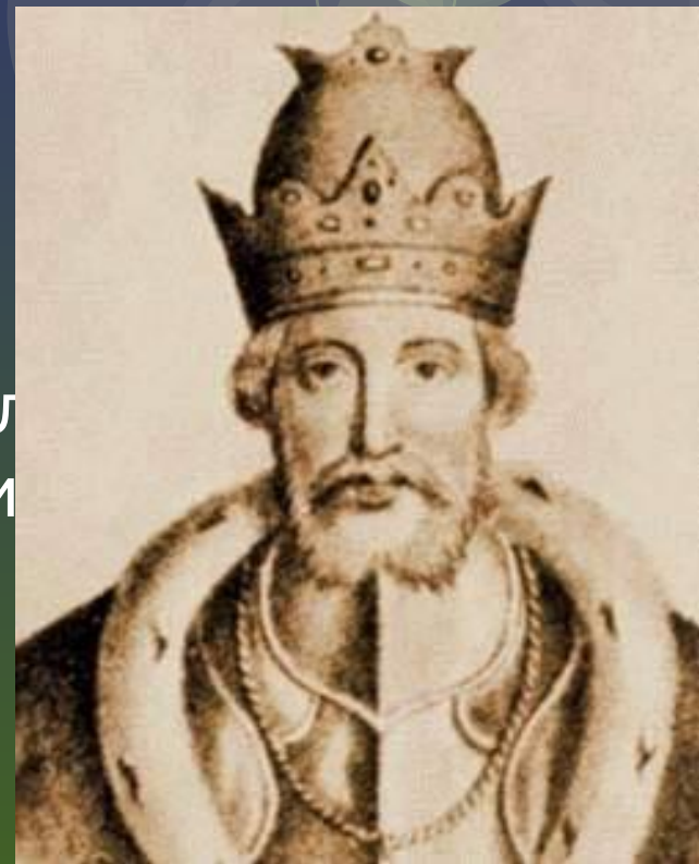
Юрий Данилович Московский

В 1304–1317 гг. ярлык находился в Твери.