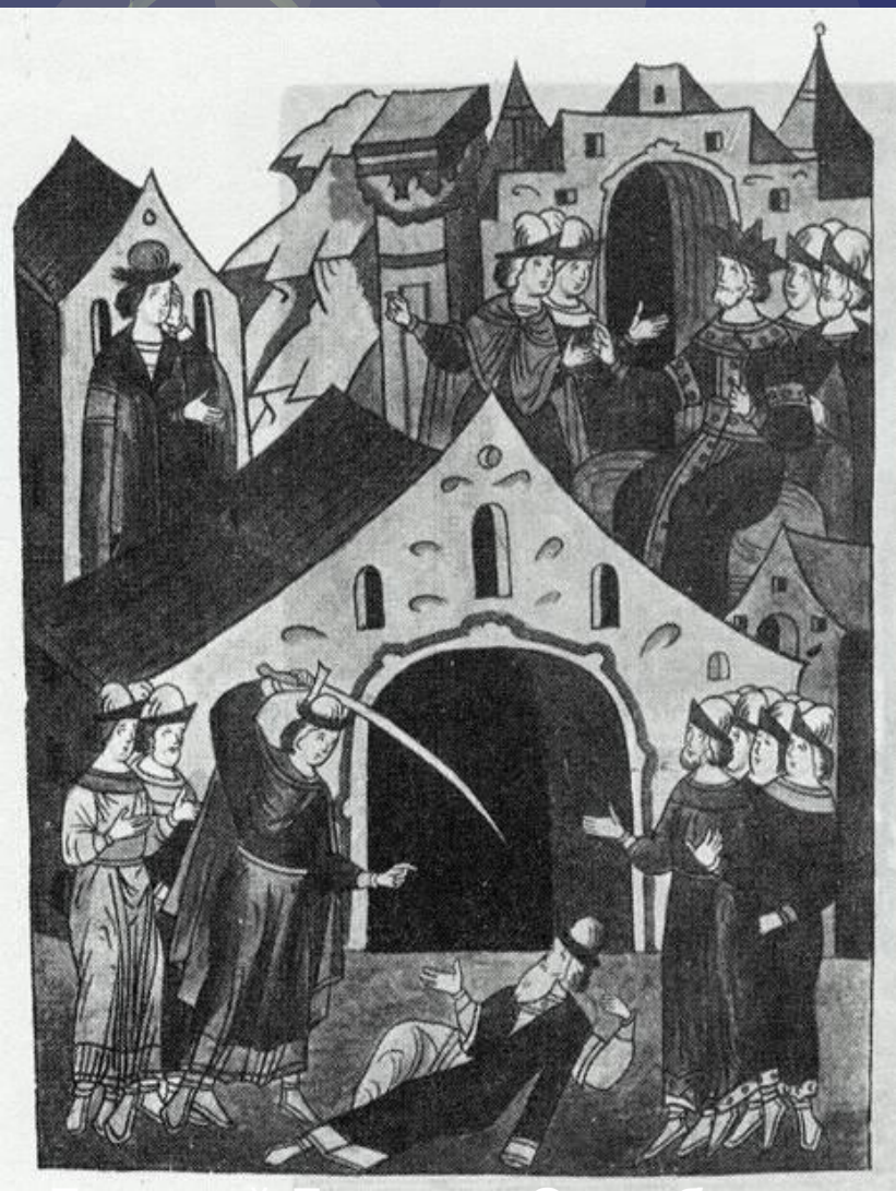
Дмитрий Грозные Очи убивает Юрия Даниловича в Орде

В 1322 г. Узбек заподозрил Юрия в утайке дани и передал ярлык сыну Михаила Тверского Дмитрию, а Юрия вызвал в Орду.