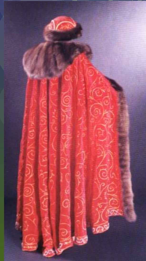
Княжеский костюм XIII-XIV веков

на своей сестре Кончаке (Агафье) и дал ему войско для борьбы с Тверью.