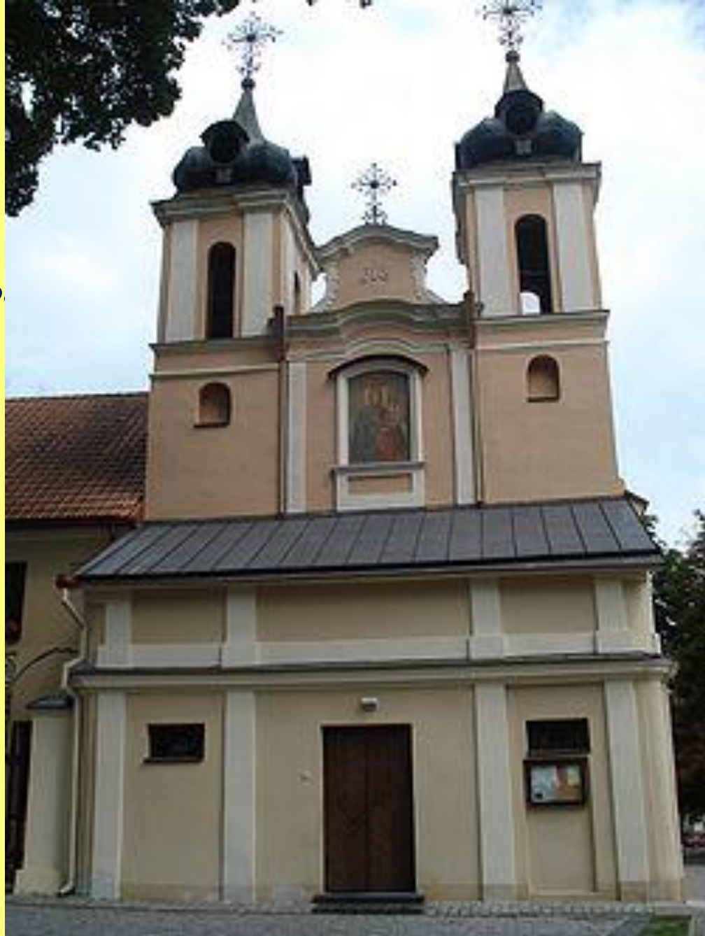
Костел Святого Креста в Варшаве