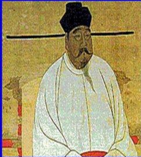
Основатель династии Сун