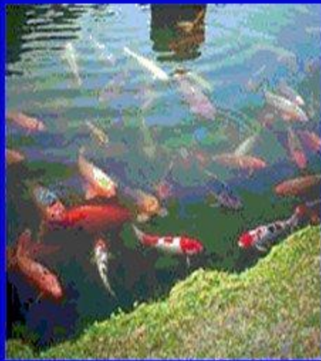
Пруд с рыбками кои