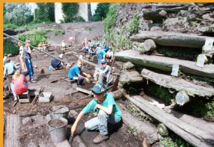
Троицкий раскоп, Великий Новгород.