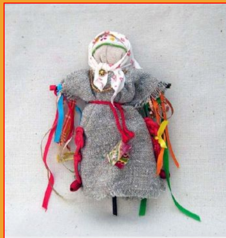
Кукла из лоскутков