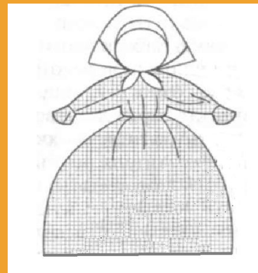
Баба на чайник