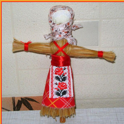
Кукла из лыка