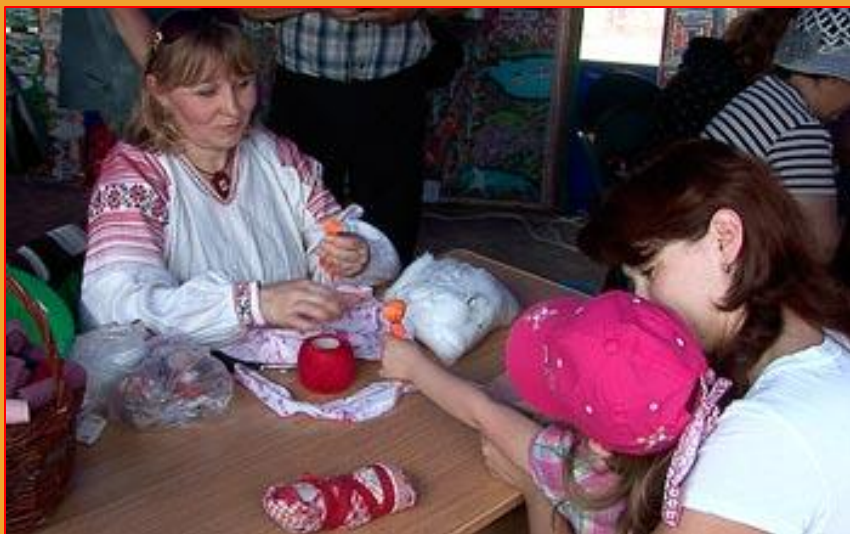
Село Крапивна, Тульская обл. Мастер –класс.