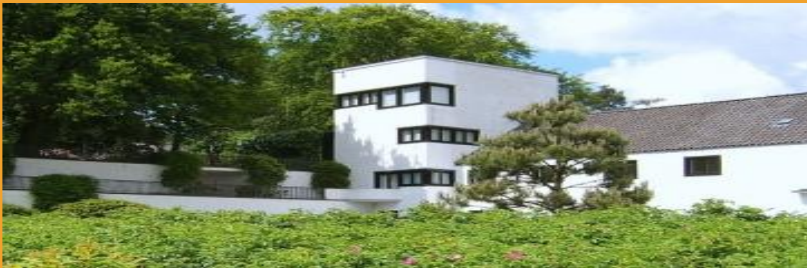
Музей кукол Falkenstein в Гамбурге.