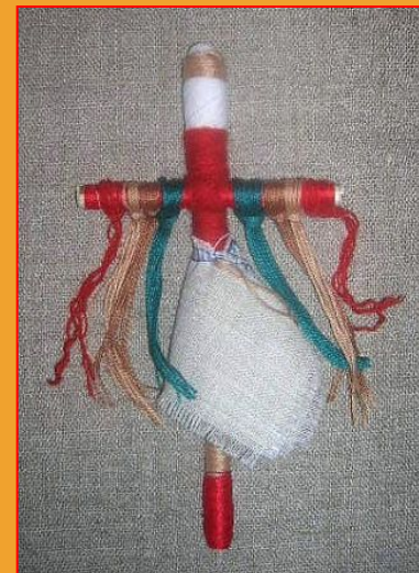
Кукла из веточек