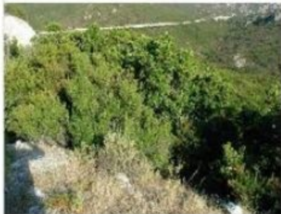
Ксерофитные кустарниковые заросли