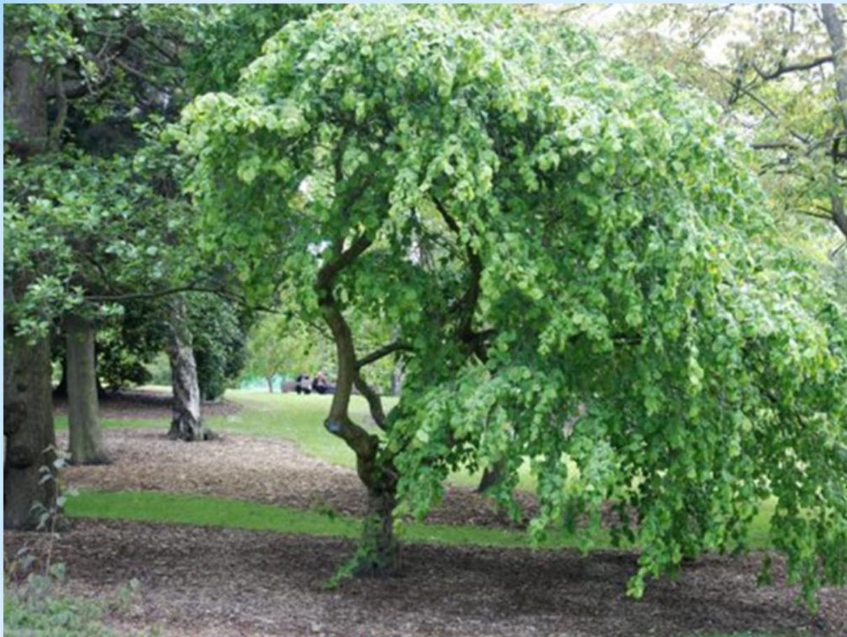
Лещина (лесной орех)