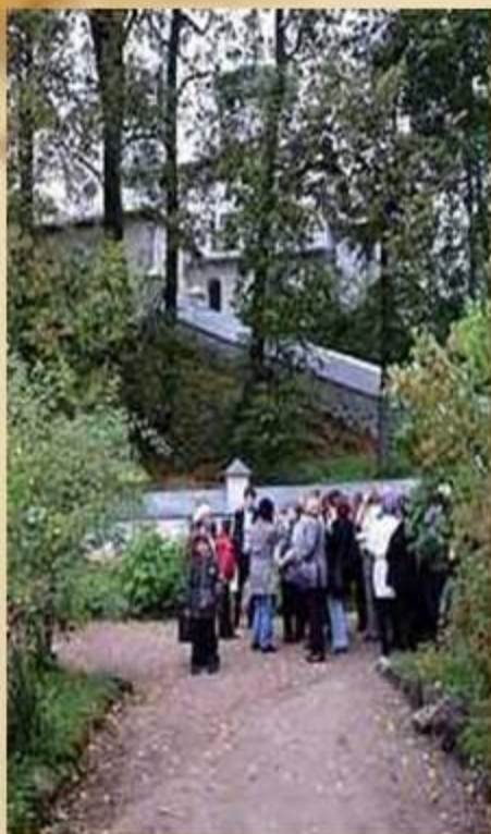
Святогорский монастырь. Могила Пушкина находится у подножия храма (в верхней части снимка, справа)