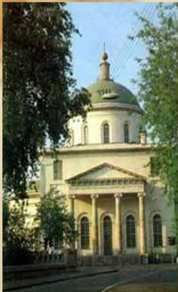
Храм Вознесения, где венчался Пушкин с Гончаровой

По возвращении из Болдина Пушкин заложил имение, женился. Свадьба состоялась 18 февраля 1831 года в Москве, но впоследствии Пушкины жили в Петербурге. В период между Москвой и непосредственно Петербургом они жили в Царском Селе, где Пушкин с помощью Жуковского мог наладить личные отношения в правительстве. А Николай I пожелал видеть жену Пушкина в качестве украшения его придворных балов.