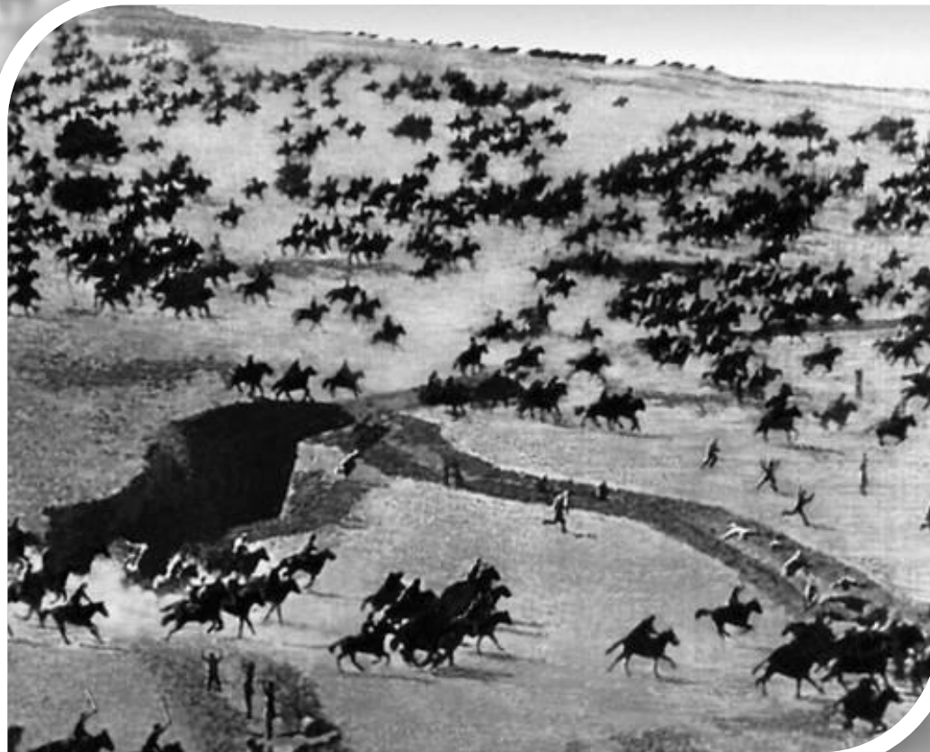
Красная конница в атаке

Главные силы были брошены на Восточный фронт. Советские войска заняли Поволжье и вели бои уже на Урале.