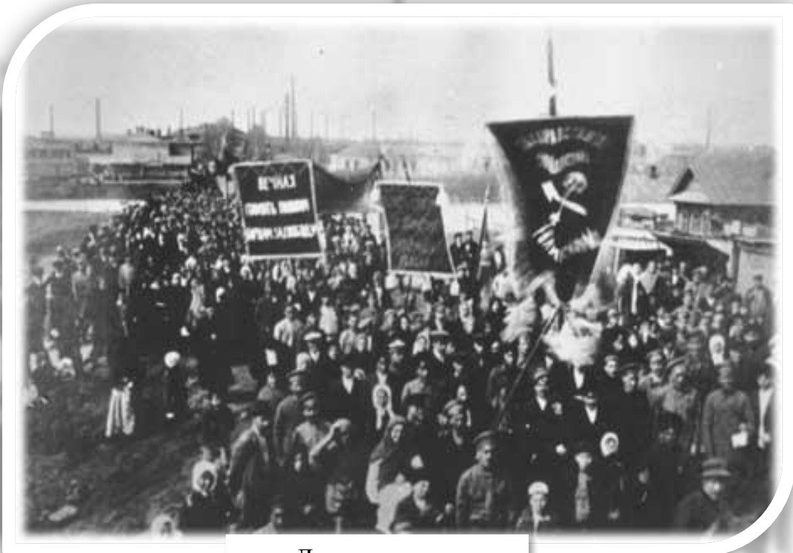
Демонстрация Ижевских рабочих

Полки ижевских и воткинских рабочих восстали против большевиков, а после подавления восстания прорывались на соединение с Народной армией.