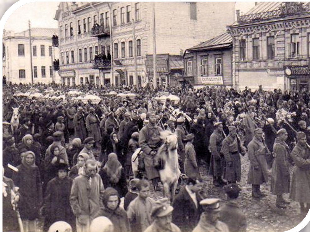
Белочехи покидают Казань

Была добыта эвакуированная часть золотого запаса России.