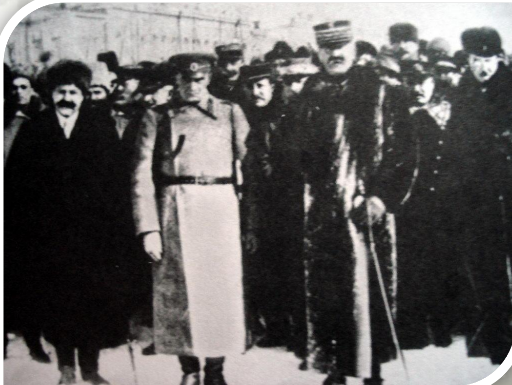
Адмирал Колчак со своим ближайшим окружением