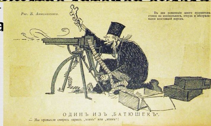
Иллюстрации из журнала "Новый Сатирикон"