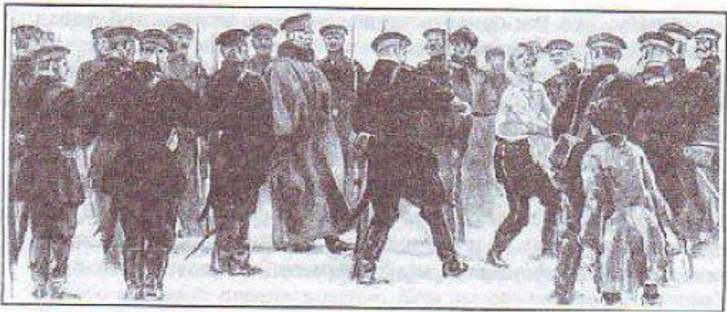
Л. Н. Толстой. «После бала». Сквозь строй. Худ. Е. Лансере