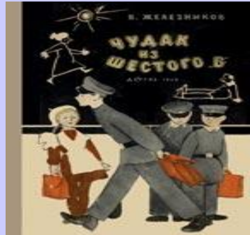
«Чудак из 6