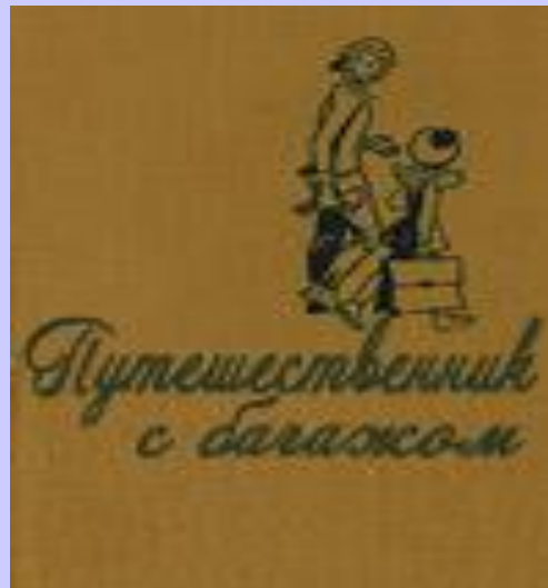
«Путешественник с багажом»