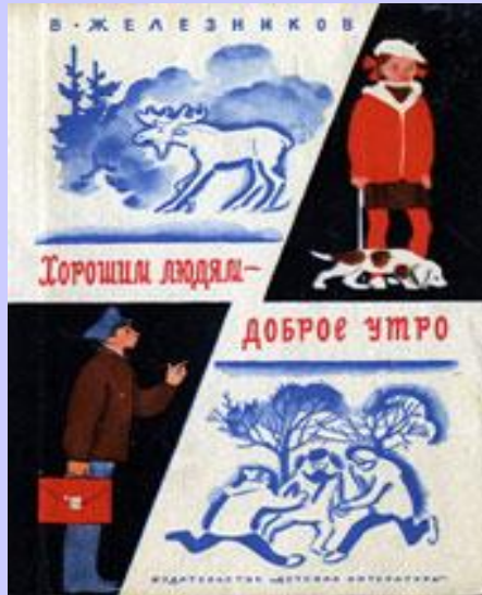
«Хорошим людям- доброе утро!»