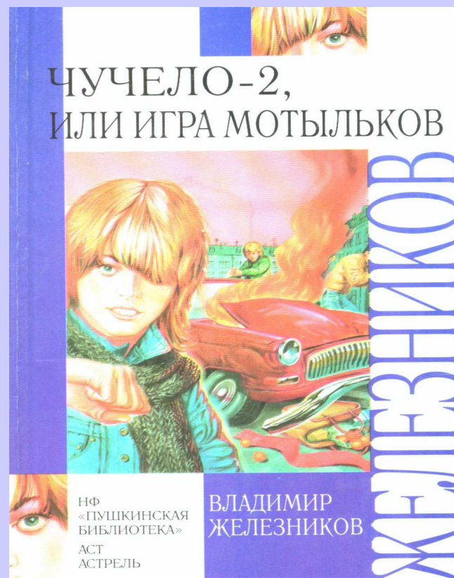
«Чучело-2, или игра мотыльков»