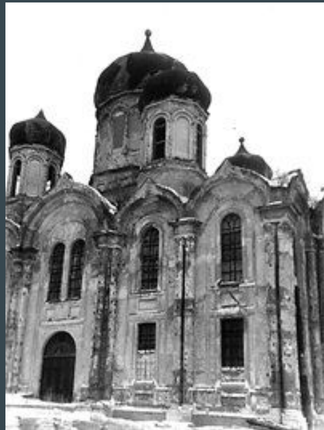
Владимирский собор в годы безбожия

В период революционных событий Задонскую обитель ожидали тяжкие испытания. В 1919 году одними из первых в стране были вскрыты мощи святителя Тихона, и началось гонение на монашествующих. В 1929 году после сфабрикованного судебного обвинения часть монашествующих была арестована и сослана в места заключения и ссылку, а другая – изгнана из стен обители. Задонский Богородицкий мужской монастырь был окончательно расформирован, а имущество конфисковано. Мощи святителя Тихона Задонского отправили первоначально в местный краеведческий музей, затем – в Елец и перед войной – в областной центр, город Орел.