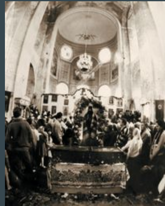
Возвращение святых мощей. 1991