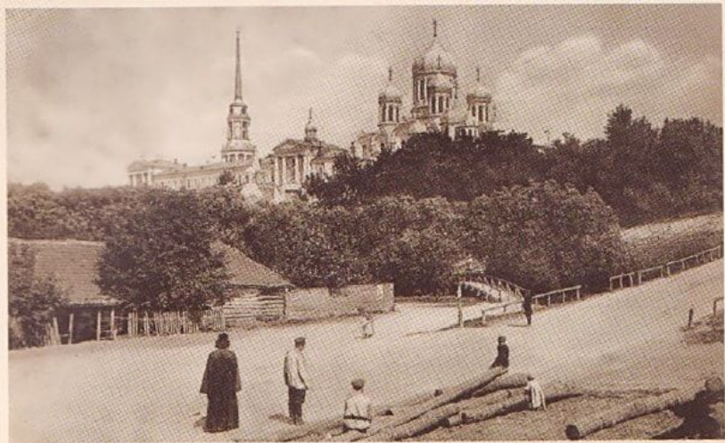
Задонский Богородицкий монастырь. Открытка начала XX в.

Восстановление обители началось в 1988 году с ремонта главного Владимирского собора. Постройки бывшего монастыря возвращались истинным хозяевам не сразу. В 1990 году первым насельникам будущей обители было выделено только несколько комнат в одном из зданий да сам собор. Только в 2003 году был завершен процесс возвращения строений, принадлежавших монастырю до революционных событий.