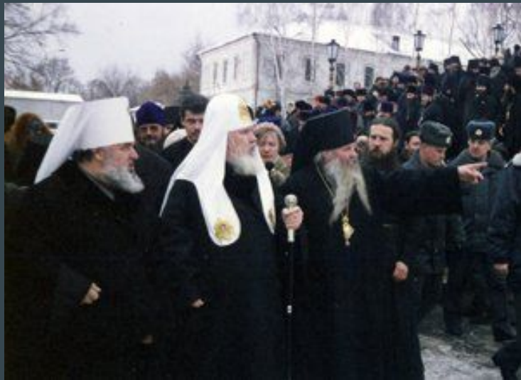
Визит Святейшего Патриарха Алексия

Восстановлен храм в честь святителя Тихона Задонского. В монастыре открылась иконописная мастерская, и иконы великолепного письма заполнили иконостас Владимирского собора.