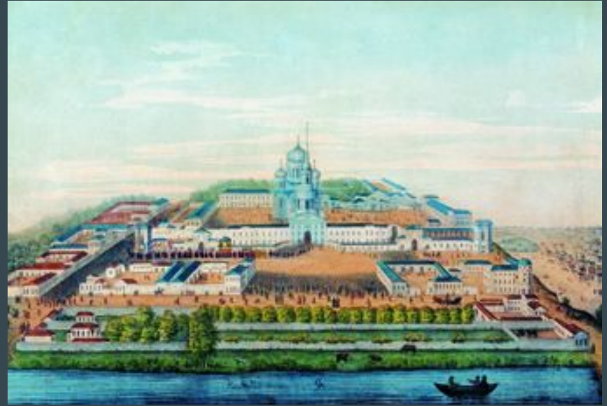
Крестный ход в день прославления святителя Тихона

В начале 19 века в монастыре осуществлялась перестройка строений. В 1845 году было начато строительство нового величественного пятикупольного восьмипрестольного трехэтажного собора в честь Владимирской иконы Божией Матери. При постройке этого храма и разборке старого в 1846 году были обретены нетленными мощи святителя Тихона. В 1861 году 13 августа состоялось его прославление.