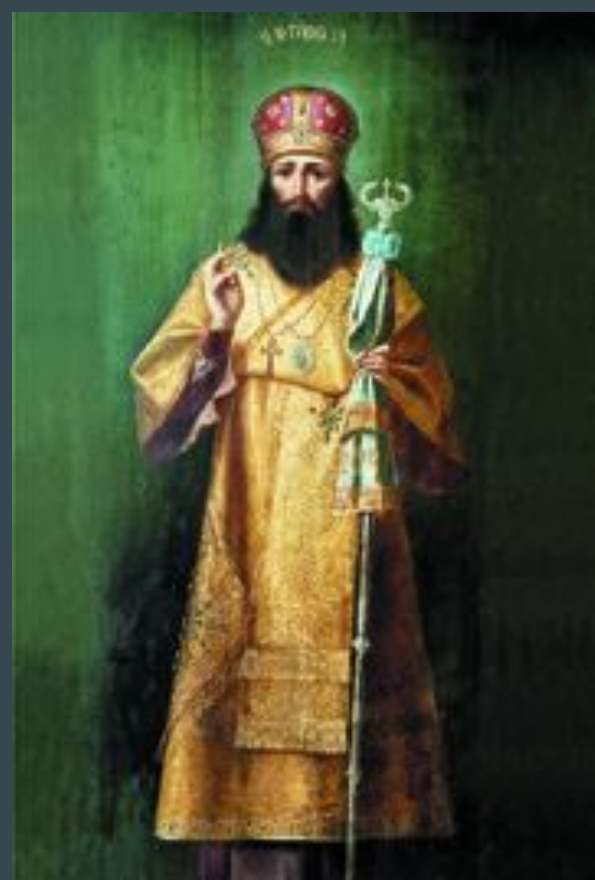
Святитель Тихон Задонский