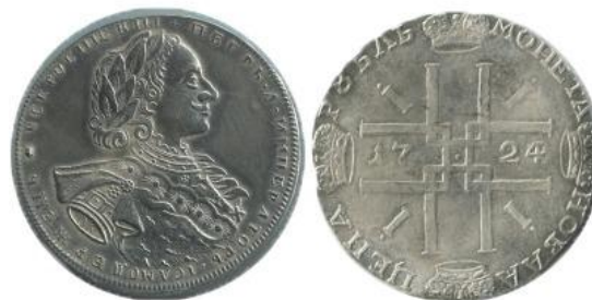
Целковый рубль Петра 1