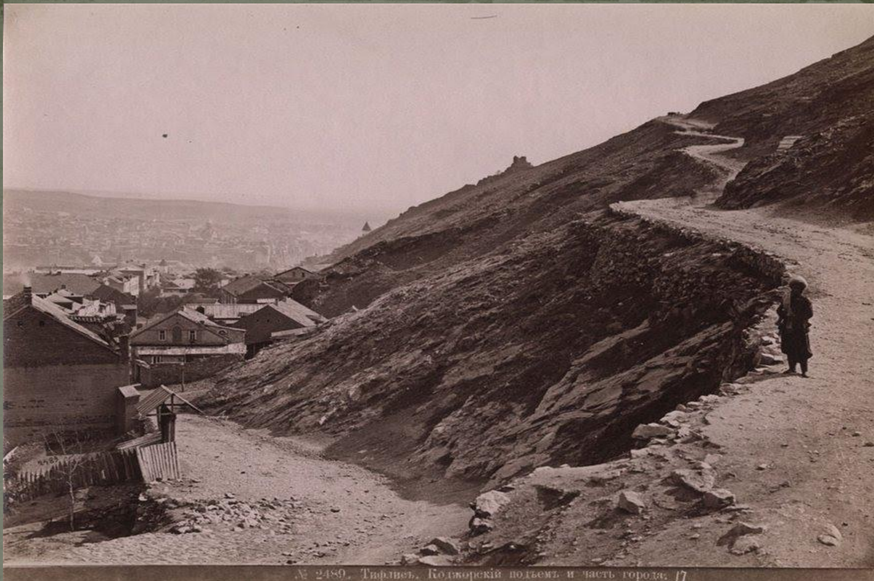
Тифлис, Коджорский подъем и часть города, 1917