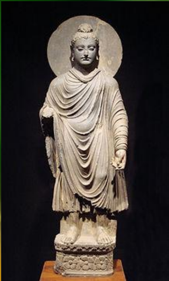
Стоящий Будда. Одно из ранних известных изображений Будды Шакьямуни