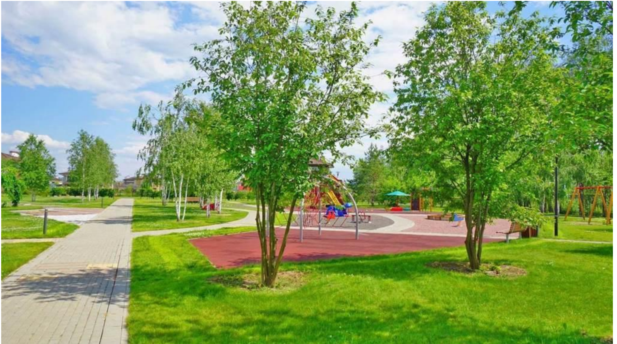
Детский игровой комплекс и универсальная спортивная площадка