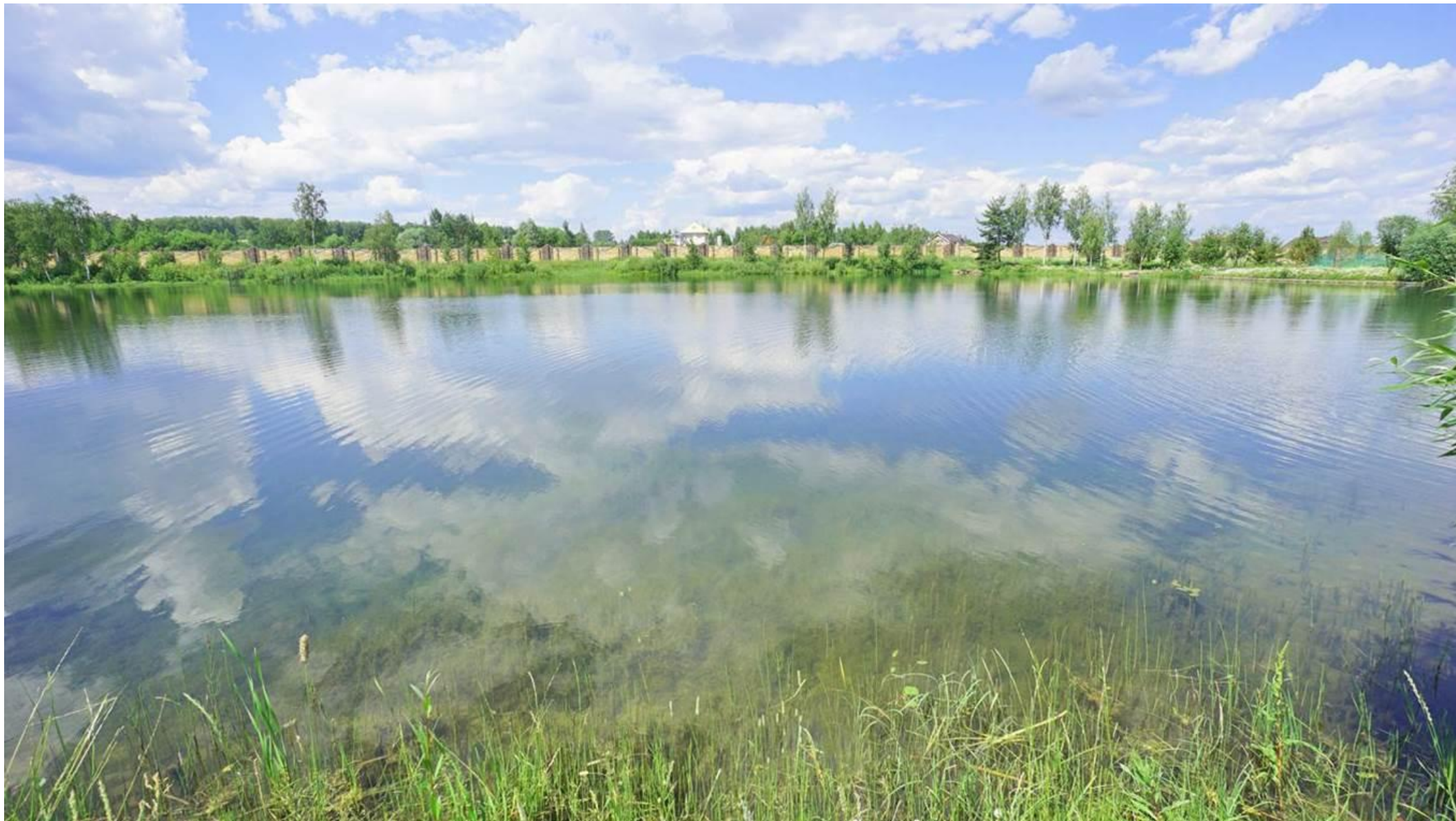
Большое озеро на территории поселка