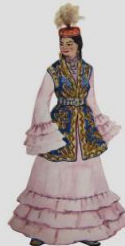
Костюм девушки. 1930 г. Северо-Казахстанская область.