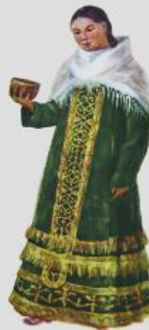
Койлек - платье девушки. Материал - бархат, вышиты золотом. Начало XX в. Восточно-Казахстанская область.