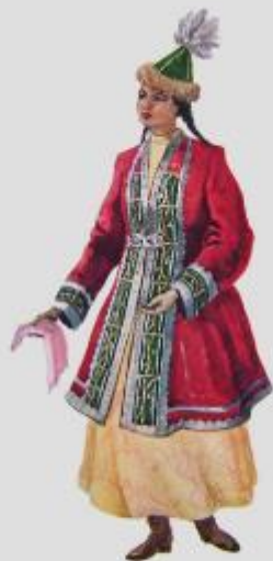
Костюм девушки. 20-е годы XX в. Акмолинская область.