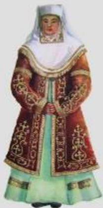
Полная, костюм женщины начала XX в. Акмолинская область.