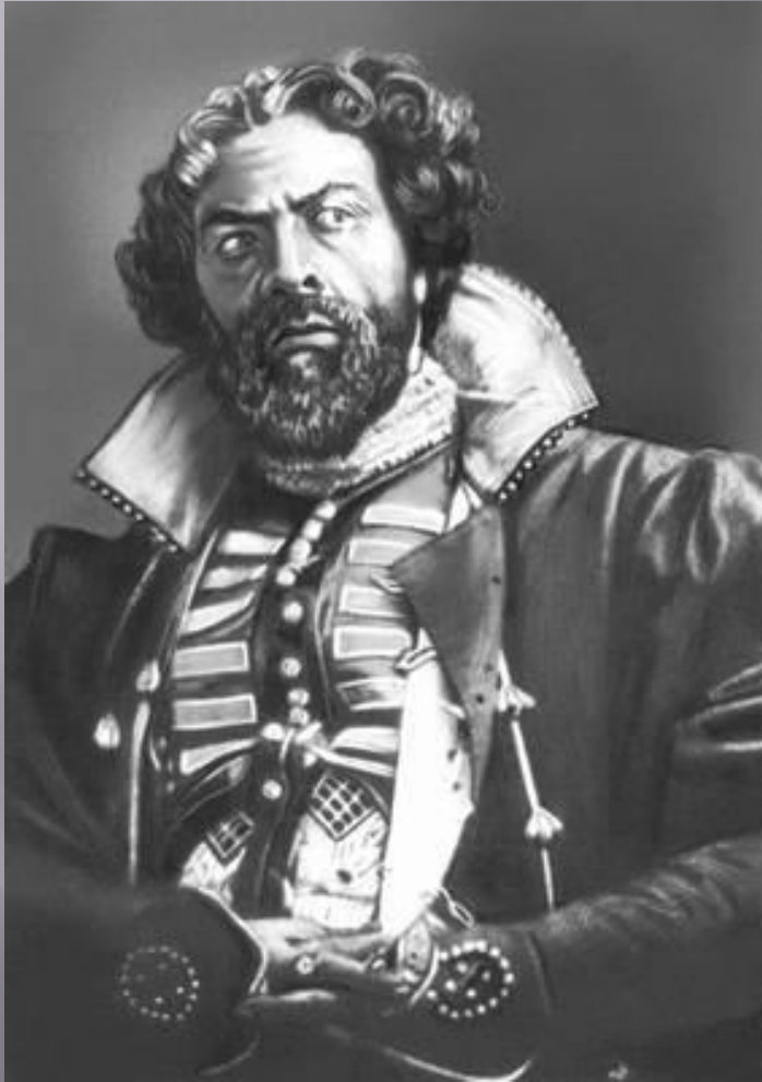
Борис Годунов (царь в 1598-1605 гг.)

7 января 1598 г. – смерть царя Фёдора I.