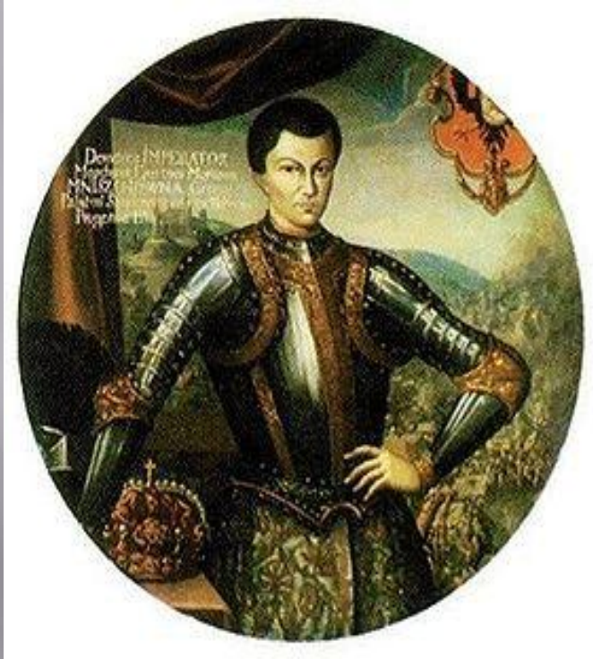
Лжедмитрий I (царь в 1605-1606 гг.)

В 1601 г. в Литве объявился якобы «чудесно спасшийся царевич Дмитрий». Его будущий тесть Юрий Мнишек набирает отряд из добровольцев-поляков и казаков из Сечи и с Дона.