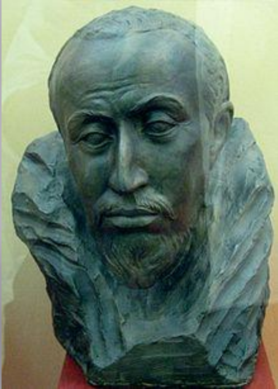
Феодор I Иоаннович (царь в 1584-1598 гг.)