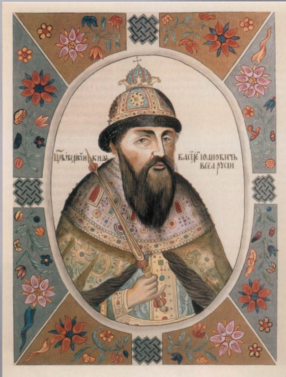
Василий IV Шуйский (царь в 1606-1610 гг.)

«Мне, великому государю, всякого человека, не осудя истинным судом з бояры своими, смерти не предати, и вотчин, и дворов, и животов у братии их... не отымати, также и у гостей, и у торговых, и у черных людей..., да и доводов ложных мне, великому государю, не слушати, а сыскивати всякими сыски накрепко и ставити с очей на очи, чтоб в том православное христианство без вины не гибли, а кто на кого солжет, и, сыскав, того казнити, смотря по вине того: что был взвел неподельно, тем сам осудится».