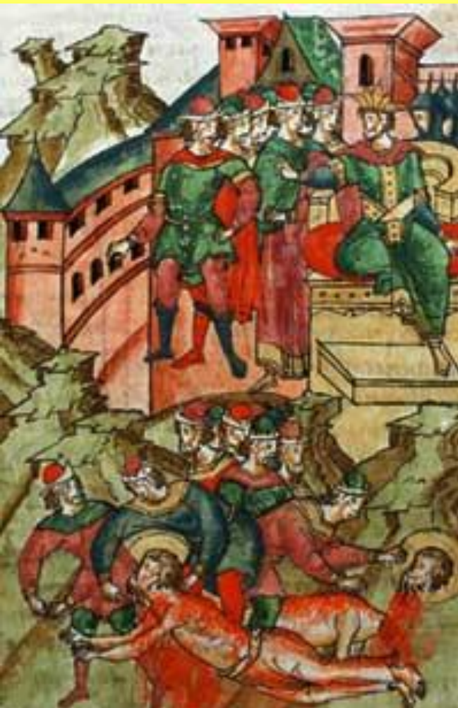
Истязание Михаила Черниговского в Орде.

В 1245 г. Ярослав Всеволодович вновь поехал в Сарай, а оттуда – в Каракорум.