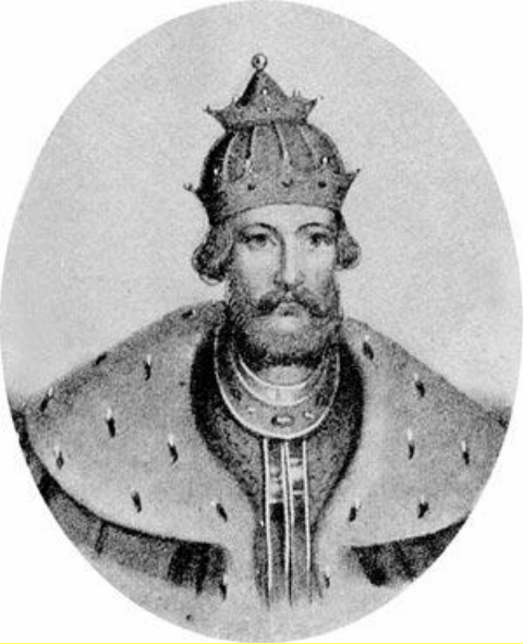
Великий князь Владимирский и Переяславский Дмитрий Александрович

Дмитрий обратился за помощью к хану Ногаю, отколовшемуся от Орды. С его помощью он вернул себе великое княжение в 1283 г.