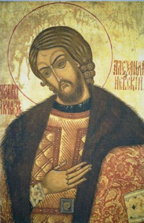
Святой благочестивый князь Александр Невский. Икона.

В 1257 г. Орда провела на Руси перепись населения – «число».