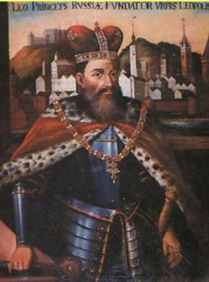
Даниил Галицкий в королевской короне и мантии.