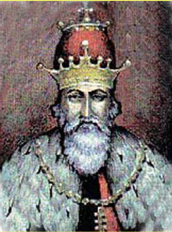
Даниил Романович, князь Галицкий, в королевской короне.

В 1250 г. Андрей женился на дочери известного своим независимым нравом галицкого князя Даниила Романовича.