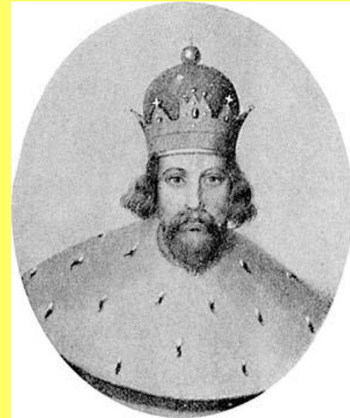
Великий князь Владимирский и Городецкий Андрей Александрович

Придя с ордынским войском, Андрей изгнал Дмитрия и разорил значительную часть земель С.-В. Руси