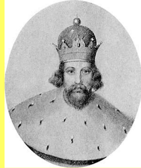
Великий князь Владимирский и Городецкий Андрей Александрович

В 1293 г. Андрей пришел на Русь с огромным ордынским войском – Дюденовой ратью.