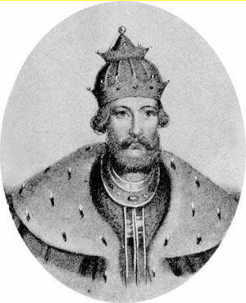
Великий князь Владимирский и Переяславский Дмитрий Александрович