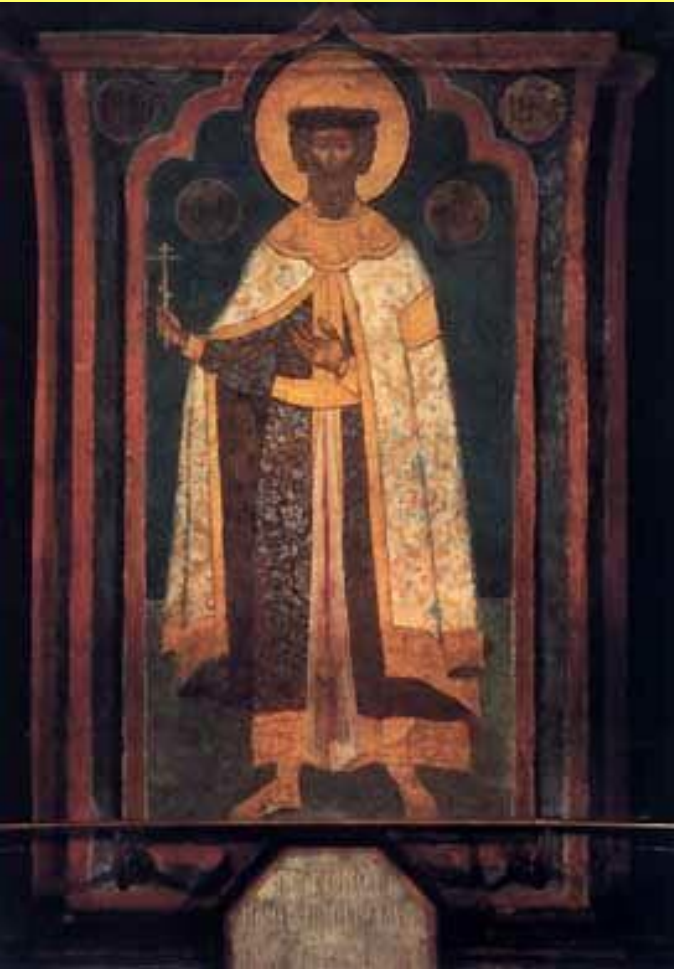
Св. Александр Невский. Фреска Архангельского собора Московского кремля.

Александр «фактически положил конец сопротивлению русских князей Орде на многие годы вперед».