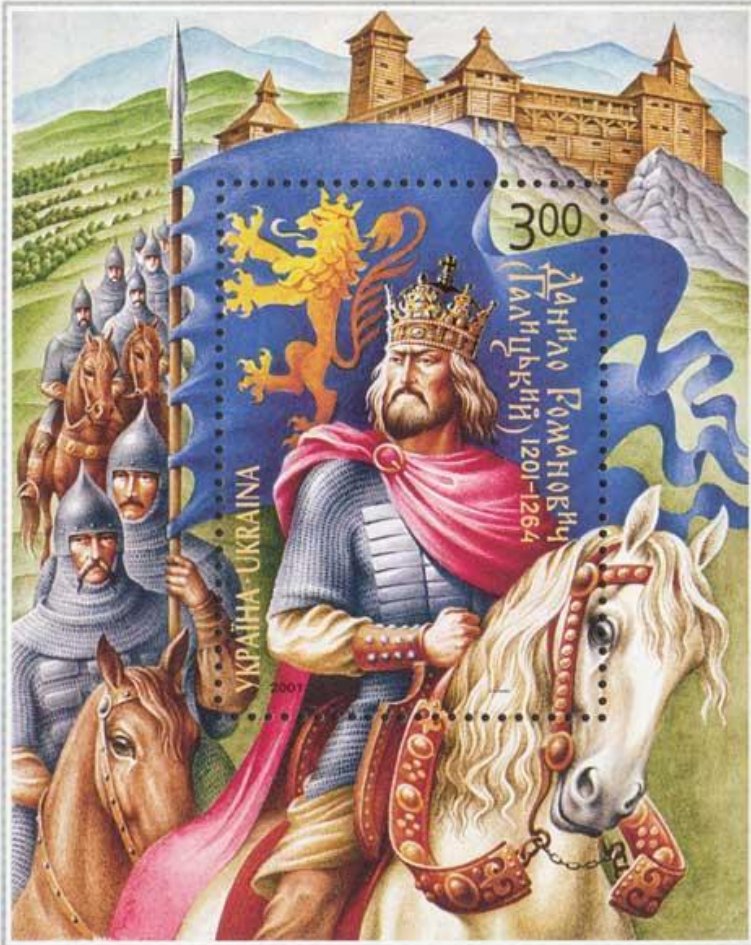
Даниил Галицкий. Современная украинская марка.

Одновременно с Неврюевой ратью Батый направил войско Куремсы против Даниила Галицкого.