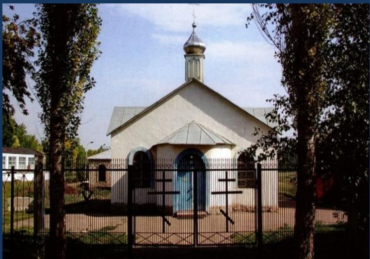
Свято-Андреевский храм города Туймазы Нефтекамская епархия Башкортостанская митрополия Русская Православная Церковь Московский Патриархат

Мечеть Аль-Фатиха построена в 1992 году. Это классическое строение, имеющее два зала для совершения молитв. Один зал предназначен для мусульман мужчин, другой – для женщин, так как религия предполагает совершение молитвы в отдельных залах.