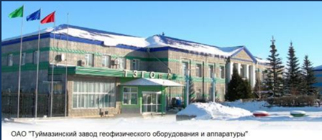
ОАО "Туймазинский завод геофизического оборудования и аппаратуры"

выпускала разнообразное геофизическое оборудование: оборудование для проведения сейсморазведочных работ, каротажные подъемники, предназначенные для проведения спускоподъемных операций при геофизических исследованиях скважин, различные специальные лаборатории, скважинных лубрикаторов для работы под давлением на проволоке автономными приборами в нефтяных, газовых и нагнетательных скважинах.